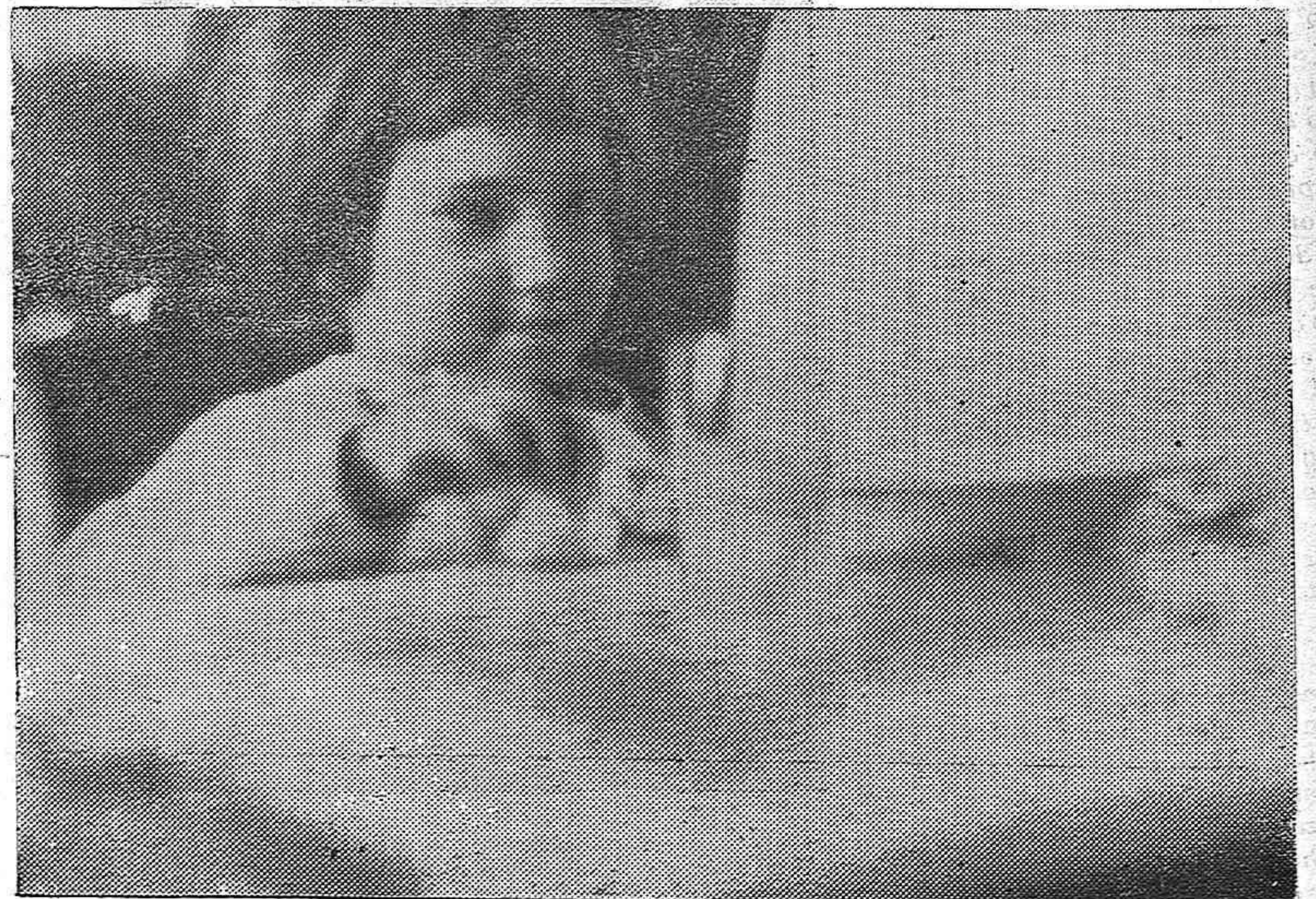
«AUXILIO SOCIAL» desea en este rigor de invierno el rostro feliz y alegre de esta pequeña socorrida, en todos los niños de España

Se reciben los donativos de libros en Prensa y Propaganda, Sección Femenina, todos los días hábiles de 12 a 2 y de 5 a 8.