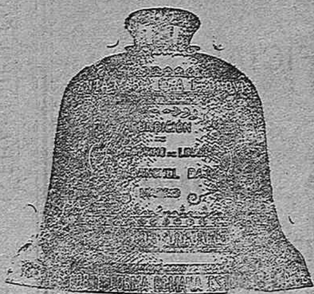
Campana forma Romana