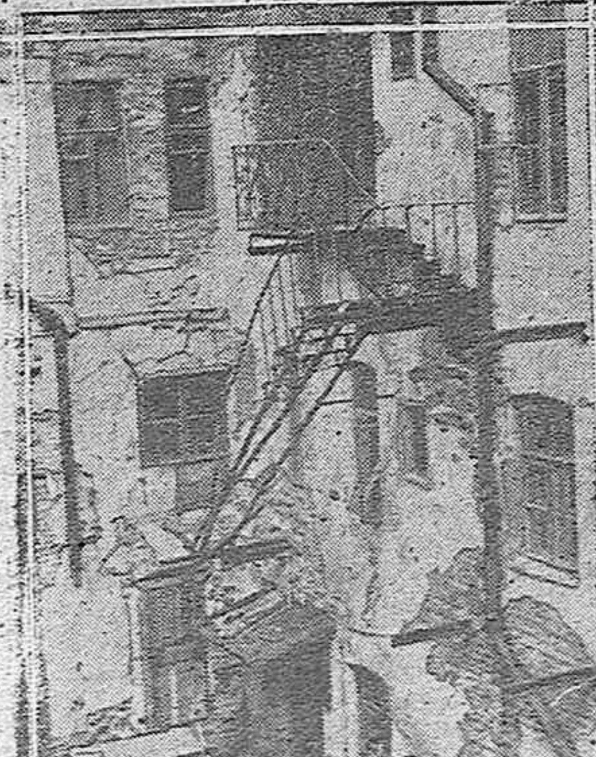
EL «PARAISO» SOVIETICO. — Vivienda obrera en la ciudad de Witebsk, que nos da una idea de la miseria que reinaba en la «patria» de todos los trabajadores.

LA FINURA INGLESA La esposa de Churchill ha visitado la Exposición Soviética que se está celebrando ahora en Londres. En esta Exposición habrá tantísimas cosas! Desde los pitillos sin tabaco y con una enorme boquilla, con lo que la fabricación soviética se las tira de nuevo, rico y de elegante, exagerando la nota de esa pequeña porción de inutilidad que toda elegancia significa, para convertirse en todo inutilidad y en definitiva, lo de siempre, pobretería... Hasta ¡que yó!, hasta esos técnicos con gafas que Rusia ha fabricado para acompañar, en gran escala, a los ministros rojos cuando iban al extranjero. Figurarán las muelas de Lenin, los