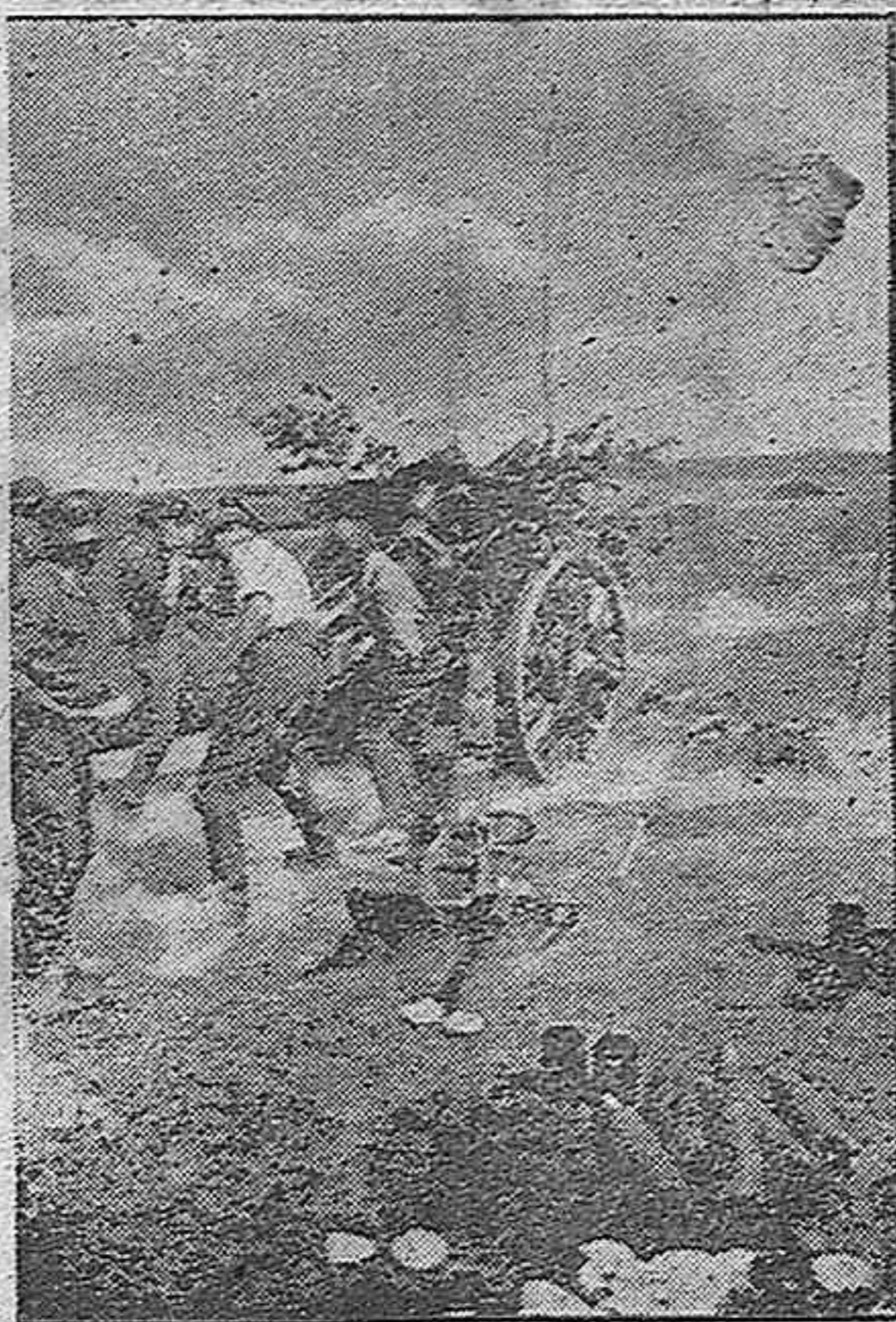
Artillería de campaña alemana disparando sobre las posiciones rojas

El Cairo, 8. — El comunicado inglés anuncia que hoy ha sido de