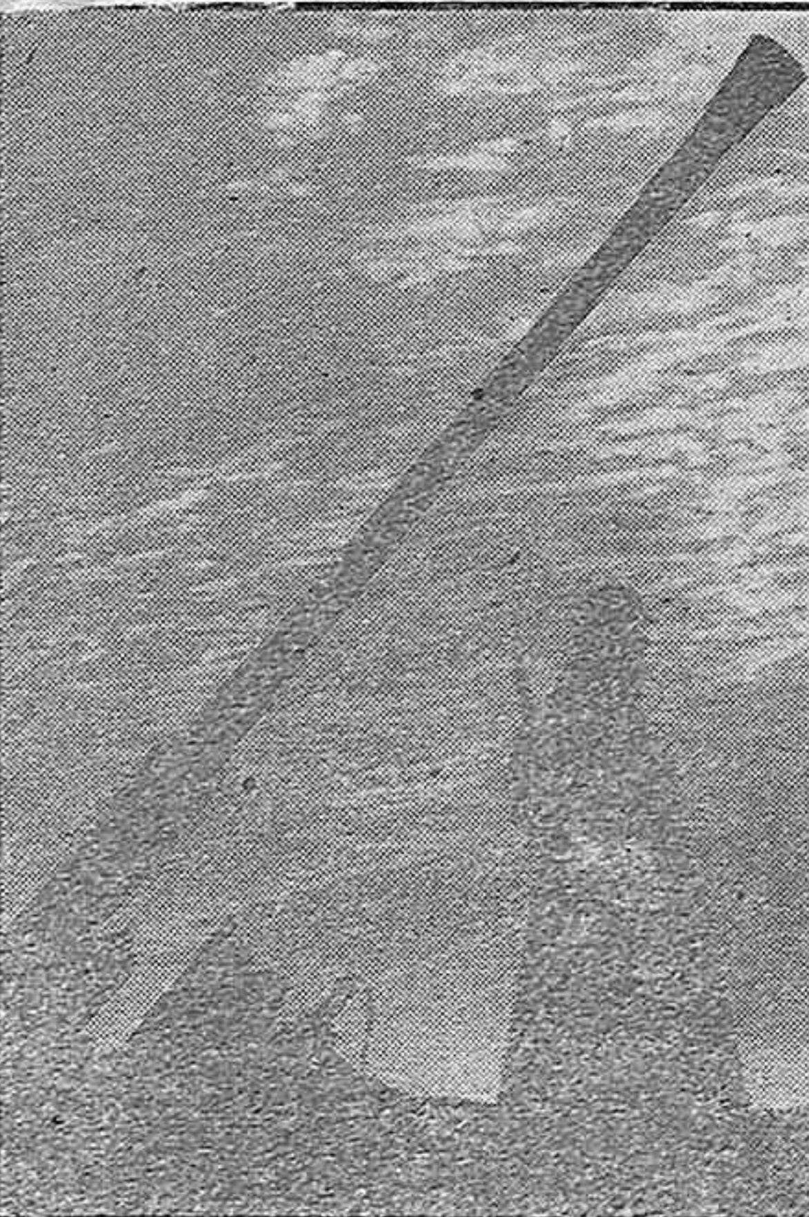
Foto mostrando a un soldado alemán que vigila un cañón antiaéreo situado en la costa atlántica

Ocupación de Candía Berlín, 29.—Fuerzas alemanas ocuparon en la mañana de hoy la ciudad de Candía (Heraklion) capital de la isla de Creta situada al norte de la isla. El puerto y el aeródromo fueron también ocupados.—Efe.