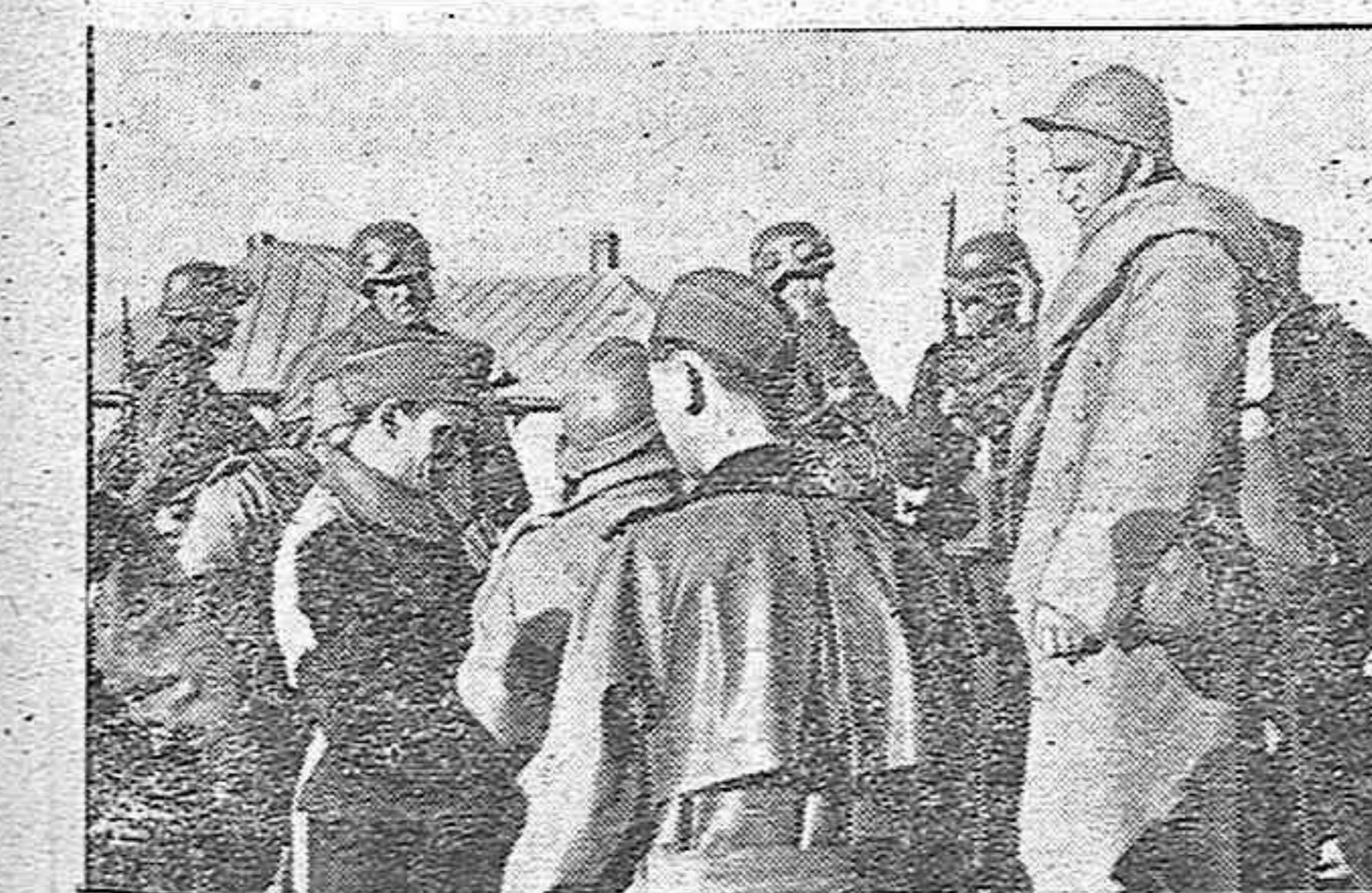
De la ocupación de Yugoslavia: estos son los primeros prisioneros servios capturados por el ejército alemán.

Nueva York, 1.—La «Associates Press» informa que el ministro de Información británico presentará próximamente la dimisión ocasionada por las últimas críticas que le fueron dirigidas.—Efe.