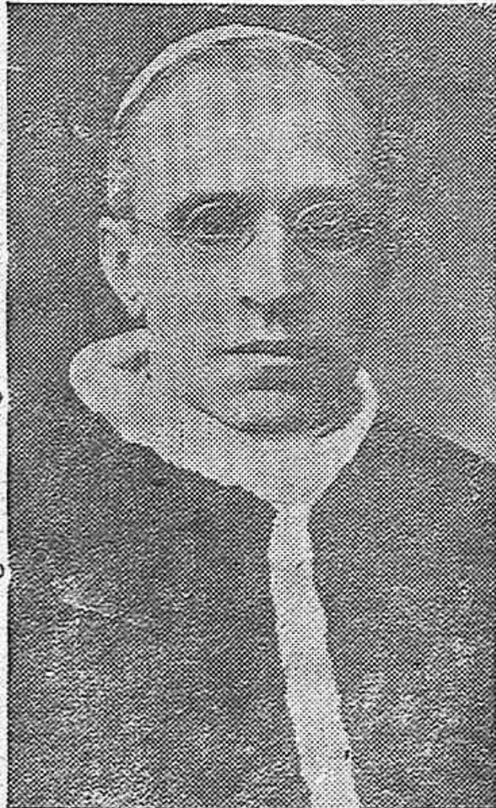
S. S. PIO XII

El próximo día 12 ocurre el segundo aniversario de la coronación de nuestro Santísimo Padre el Papa Pío XII. Ya que no fué posible, por causas ajenas a nuestra voluntad, publicar en el último número del «Boletín Eclesiástico» la acostumbrada circular exhortando al Clero y fieles de la Diócesis a celebrar como se merece esa fiesta que justamente va adquiriendo carta de naturaleza entre los católicos españoles, queremos recordar hoy a nuestros diocesanos, por medio de las presentes líneas, que, a semejanza de lo que se hizo en años anteriores, podría también este celebrarse, en ese mismo día 12, o en el domingo anterior o posterior a esa fiesta, si pareciera más oportuno, algún acto de culto religioso, como misa de comunión general, función eucarística vespertina, rogativa, etc. explicando los sacerdotes a sus fieles lo que significa el Papa para la Iglesia y para cada uno de los cristianos, y los deberes que a todos nos ligan con el Vicario de Cristo, poniendo todos en las augustas manos del Pontífice, para que disponga de ellas como mejor le plazca, conforme a sus altas intenciones y teniendo en cuenta las gravísimas y múltiples necesidades de la hora presente, las oraciones y demás obras buenas de piedad y misericordia que en este día practiquemos.