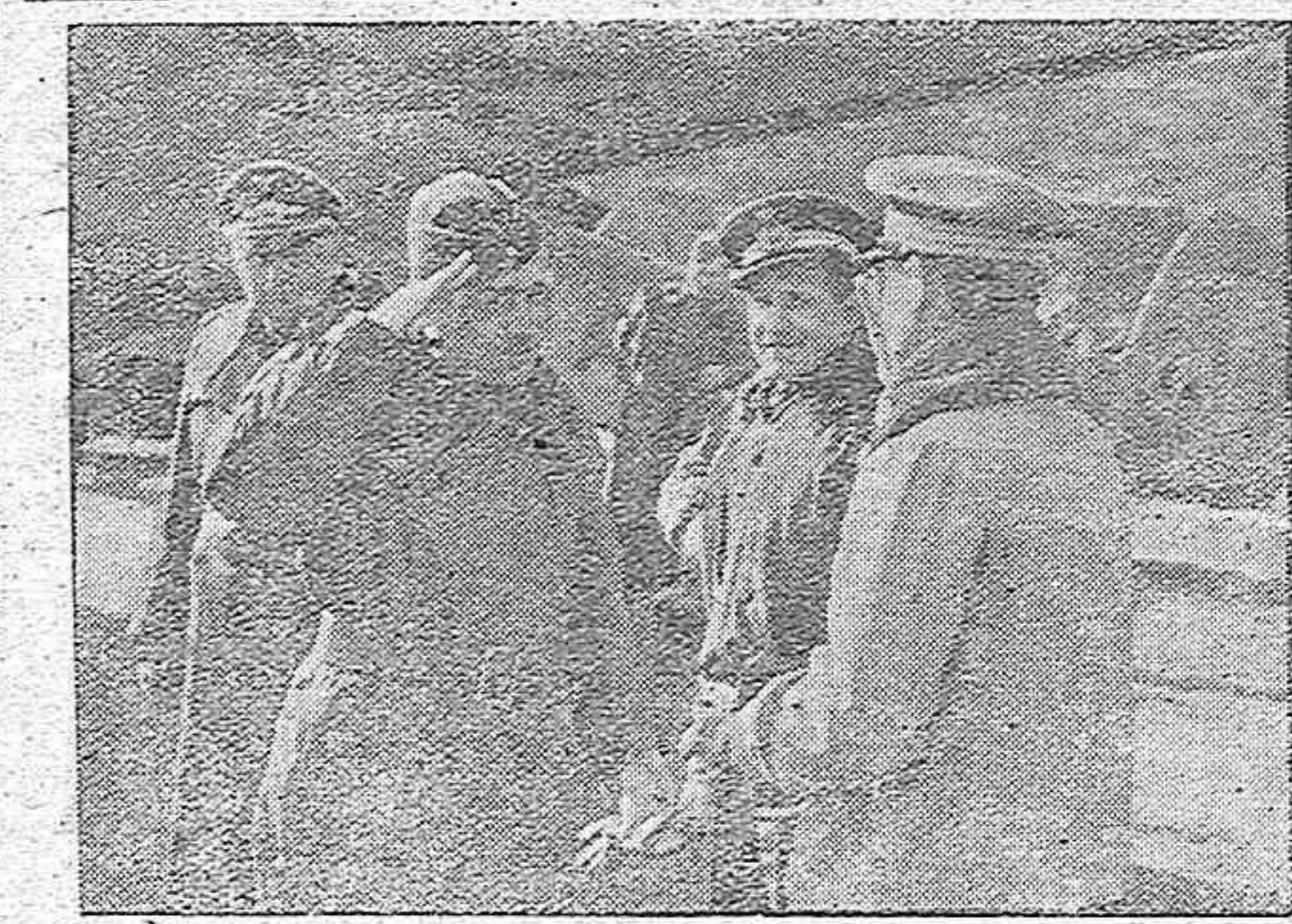
Mussolini dijo el domingo: «La colaboración entre nuestras fuerzas armadas se basa en la camaradería y en la cordialidad. Y el grabado nos muestra al capitán jefe de una escuadrilla alemana que se presenta al jefe de una base aérea en Italia»

Londres, 24.—Según un comunicado del Cairo aviones británicos bombardearon en Albania la ciudad de Dukaj. En este ataque perdimos un caza y un bombardero.—Efe.