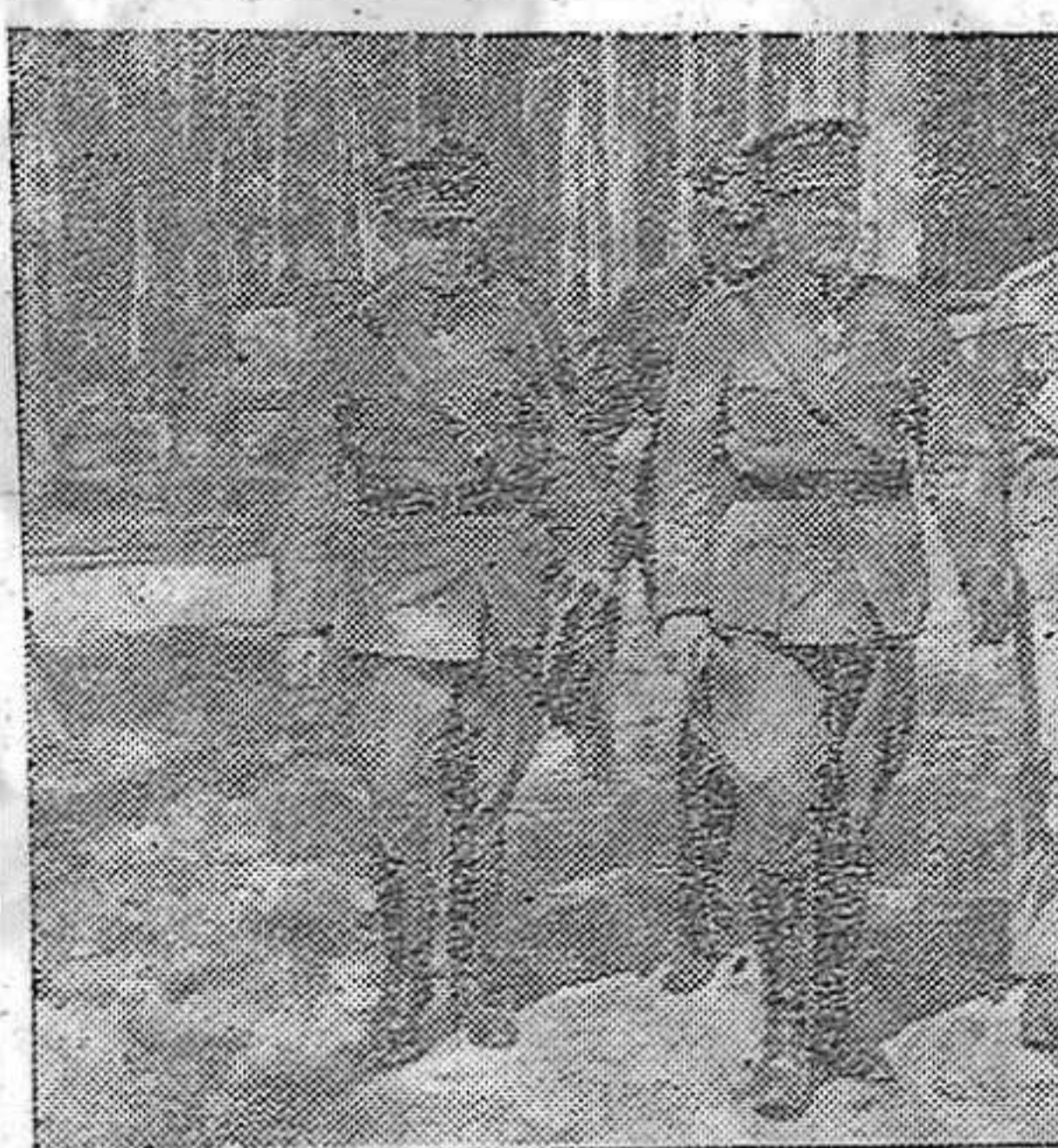
1. El jefe del Estado Mayor finlandés, general Heinrich, ha visitado el Cuartel General del Führer acompañado del general Talvela también finlandés. 2. Estos soldados alemanes expresan en sus rostros la dureza de la lucha en una ciudad soviética que ha sido preciso conquistar casa por casa

mente digna de resaltar (y con este motivo conviene observar que dicha resistencia se deja sentir principalmente después de la visita a Moscú