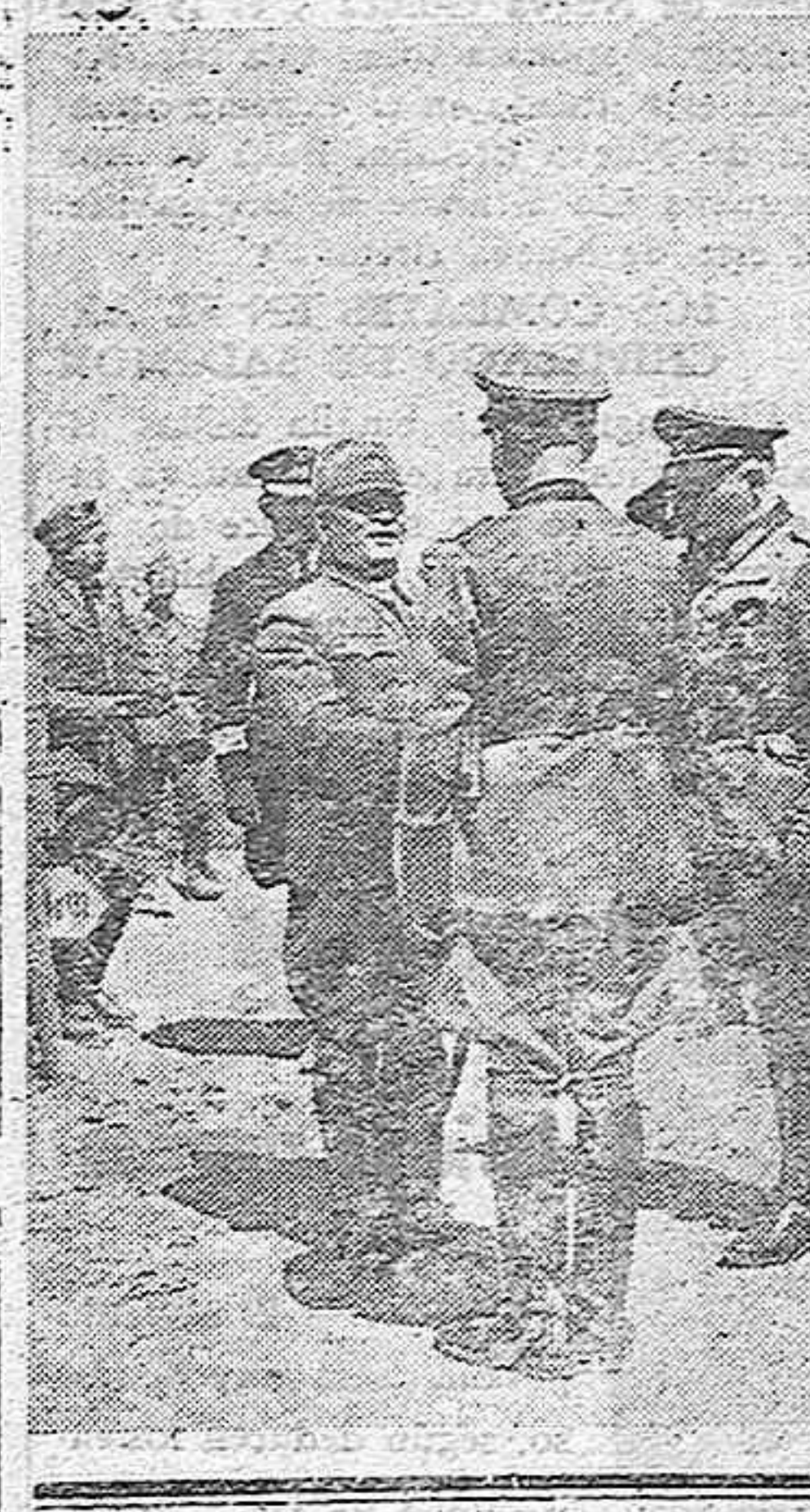
El General Oshima visita el frente del Este

El embajador japonés en Berlín, general Oshima marchó al frente oriental para visitar la zona de combate de Rostow-Batisk. En el aeropuerto de Rostow fué saludado por el comandante de la ciudad. A la derecha el comandante jefe del cuerpo de ejército coronel general Ruoff condecorado con la cruz de caballero.