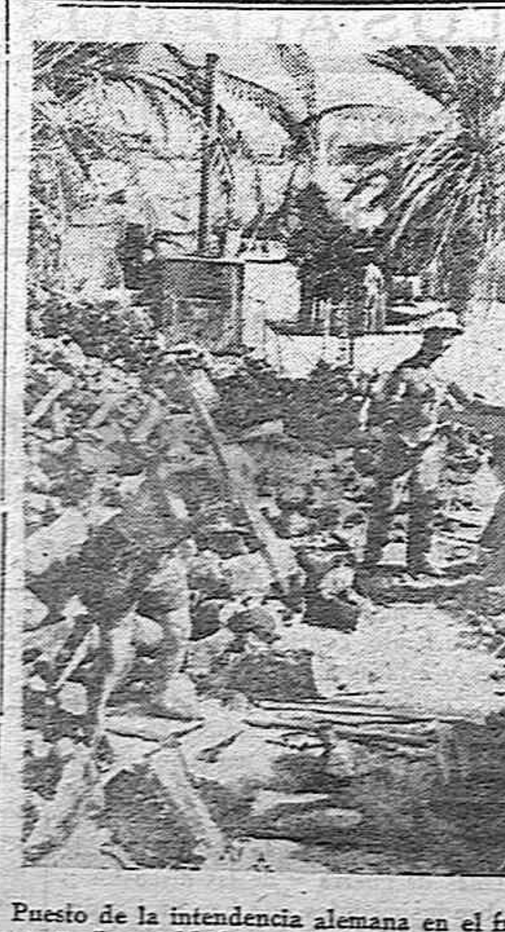
Puesto de la intendencia alemana en el frente africano. Los soldados de turno hacen la leña que servirá para cocer el pan.