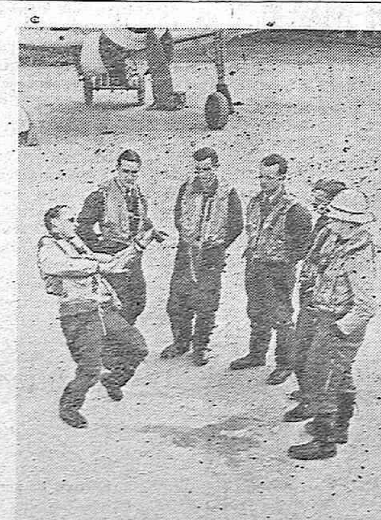
Un capitán de escuadrilla alemán describiendo a sus compañeros la táctica que empleó en su último combate aéreo con el enemigo.