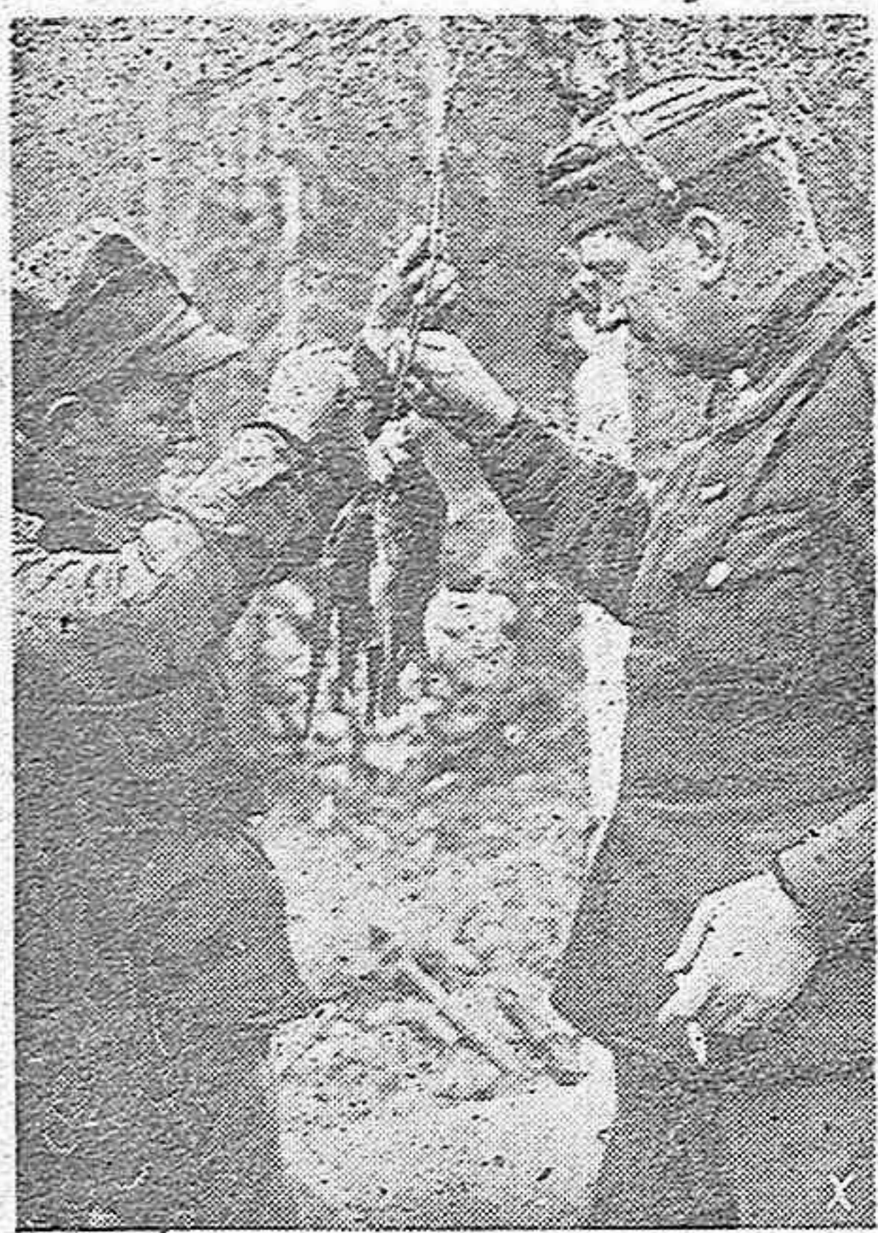
Soldados alemanes y finlandeses. He aquí a estos dos que han pescado unas truchas en el arroyo y se las reparten fraternalmente.

durado 23 días, y la de 1854-55, llevada a cabo con la para entonces enorme cantidad de 800 bocas de fuego, que arrojaron 1.350.800 proyectiles y que requirió 349 días para que el defensor de la plaza, Todleben, izase bandera blanca. Las pérdidas anglofrancesas en aquella ocasión, termina el informe, fueron de 80.000 hombres, y las rusas, de 120.000.