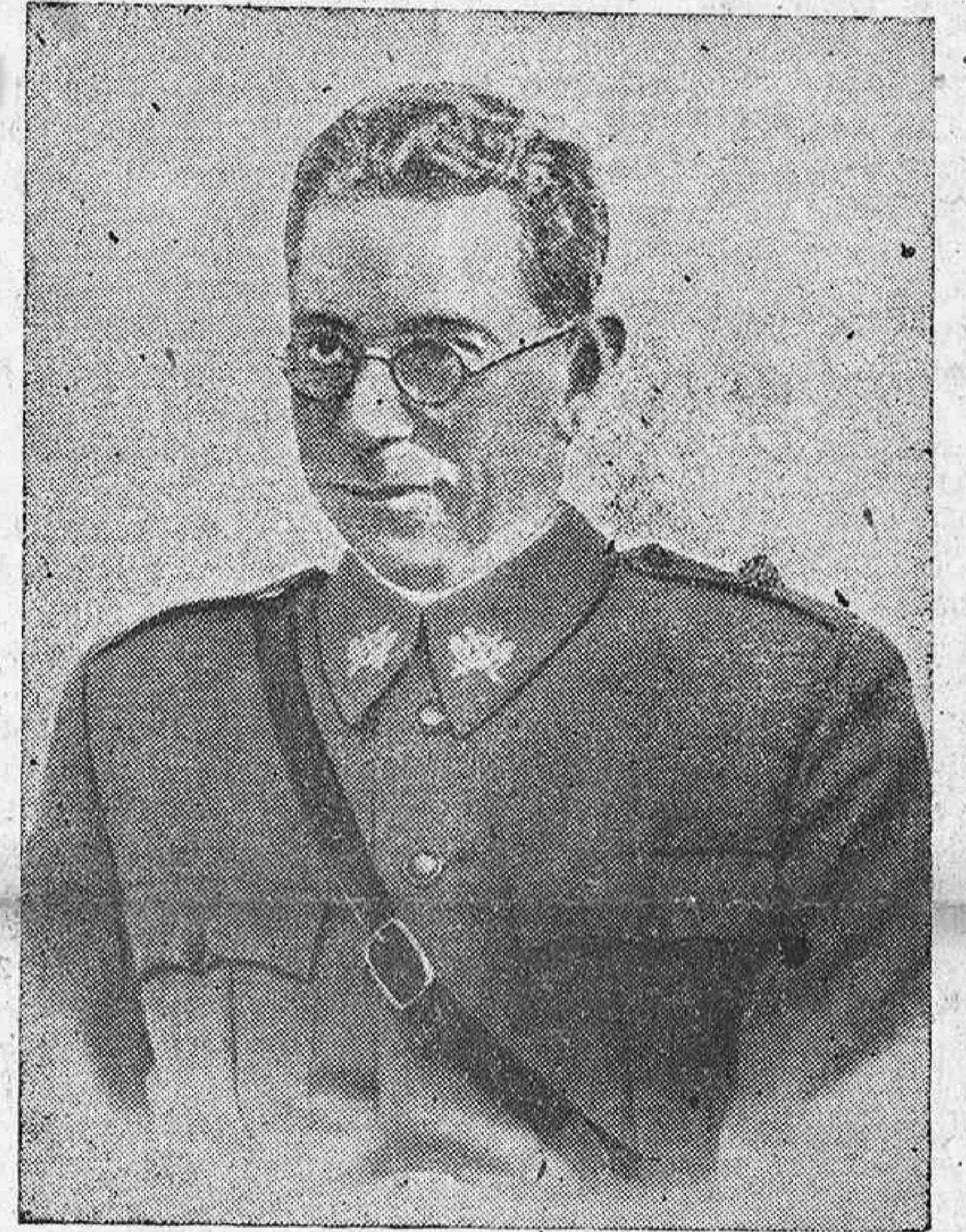
† EXCMO. SR. D. EMILIO MOLA

EL AVISADOR NUMANTINO, al rendir homenaje al Caudi-