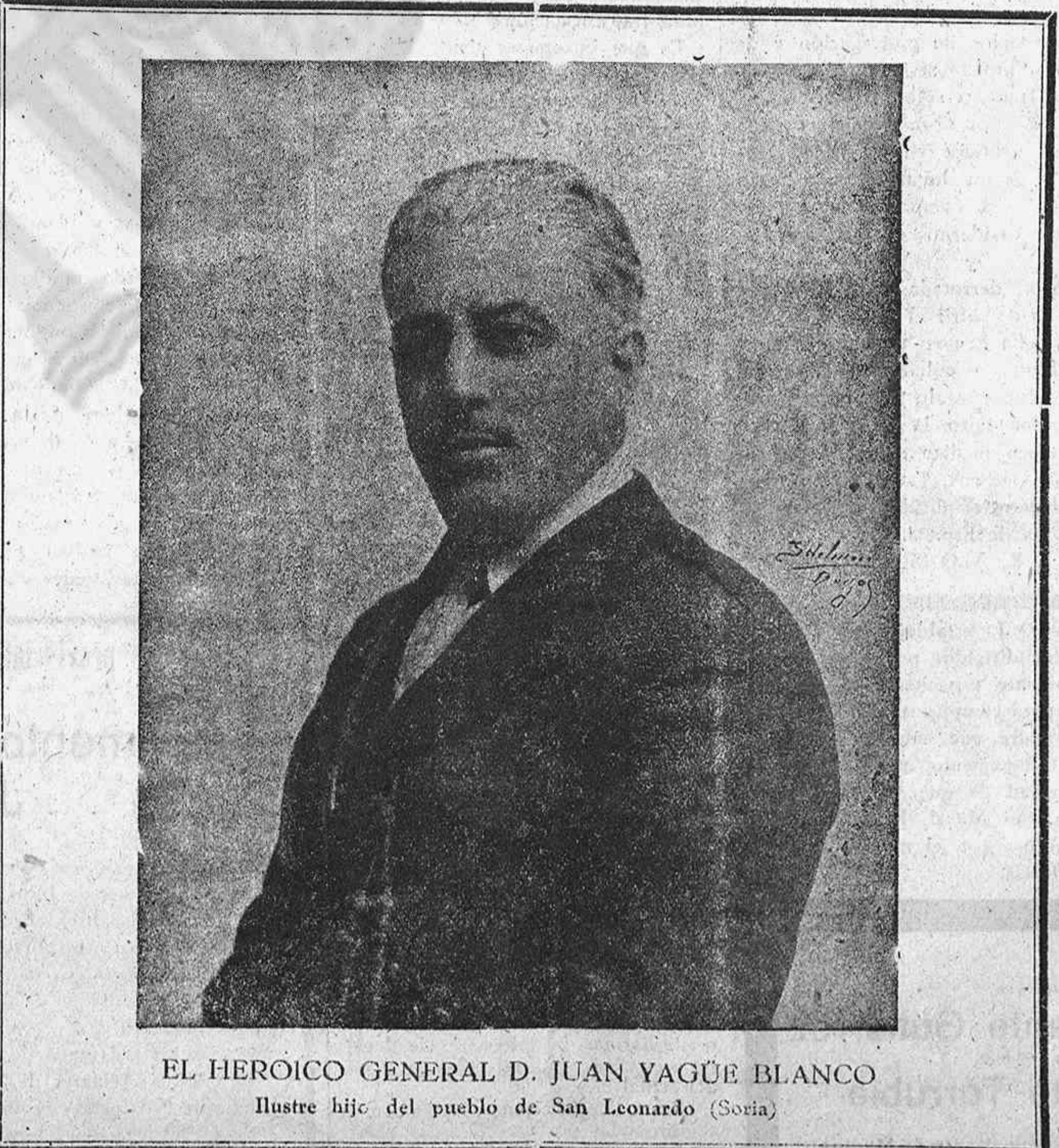
EL HEROICO GENERAL D. JUAN YAGÜE BLANCO Ilustre hijo del pueblo de San Leonardo (Soria)

providencial, la noble figura en la que España había puesto acertadamente todas sus ilusiones de salvación, el genial Caudillo Excelentísimo señor Don FRANCISCO FRANCO BAHAMONDE, y, poniéndose al frente del ejército marroquí, llega a las costas nacionales para dirigir la lucha que se con-