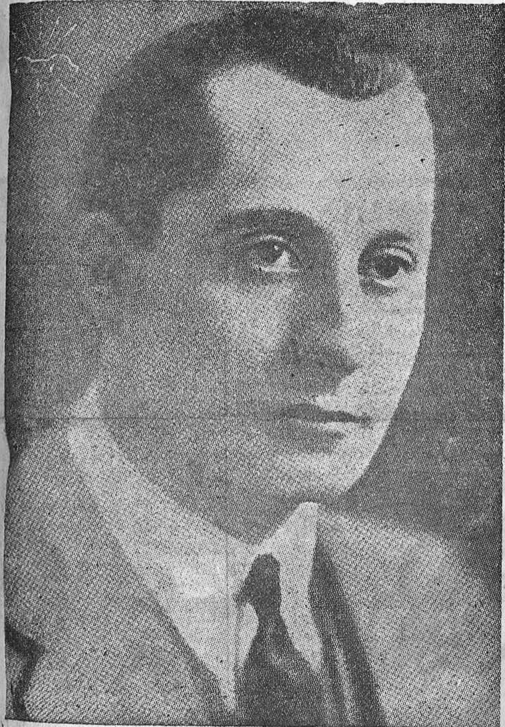
† JOSE ANTONIO PRIMO DE RIVERA

El cobarde y vil asesinato de Calvo Sotelo, ordenado por su envidioso paisano Casares Quiroga, hizo estallar el glorioso Movimiento Nacional que había de librar a