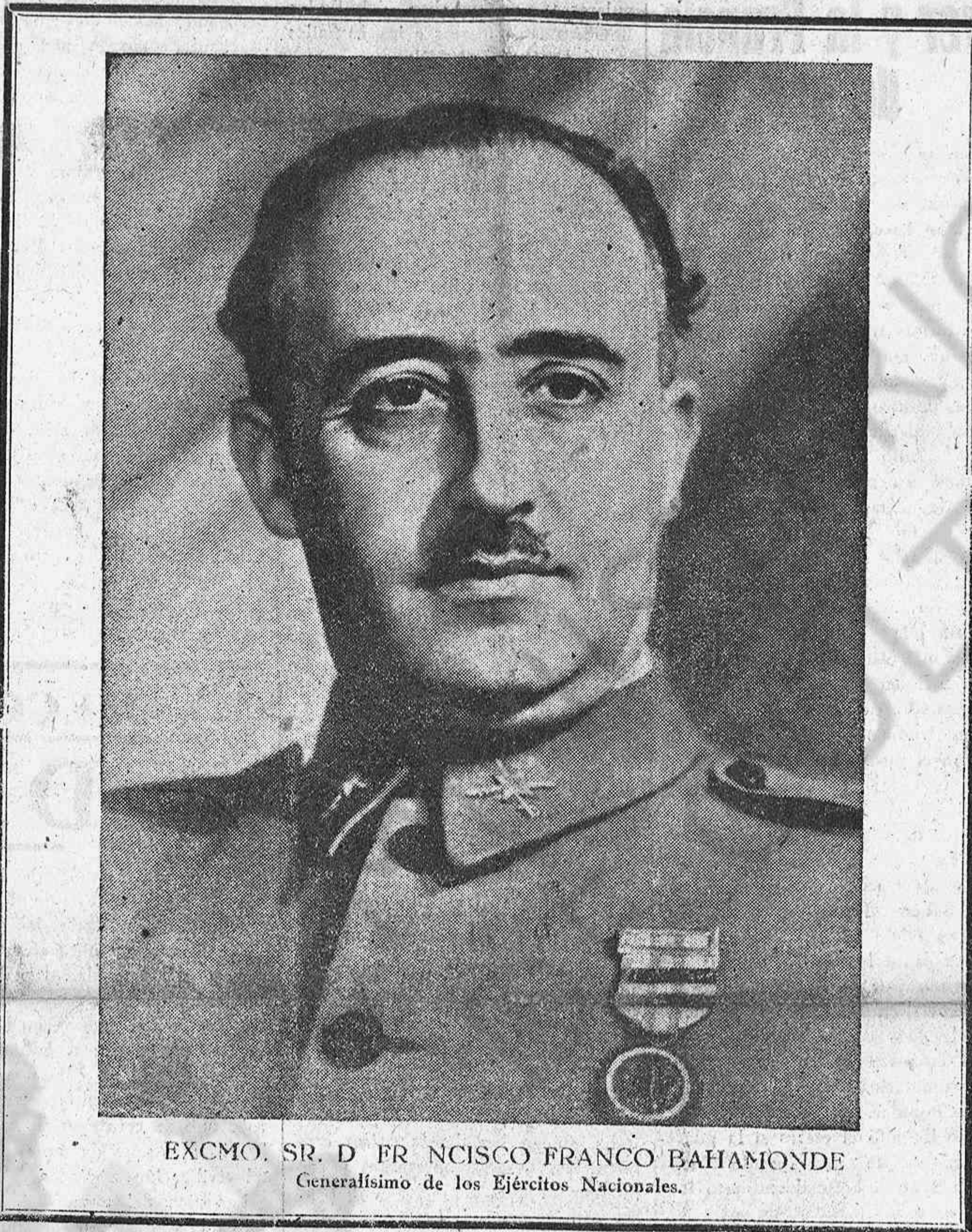
EXCMO. SR. D. FRANCISCO FRANCO BAHAMONDE Generalísimo de los Ejércitos Nacionales.

El día 17 de julio, hoy hace cuatro años, la guarnición de Melilla inició el alzamiento redentor de España, triunfante en las plazas africanas, por la decisión, valentía y heroísmo de los jefes, oficiales y soldados del Ejército, del Tercio, de los Regulares y de la Guardia Civil, con nuestro invicto paisano,