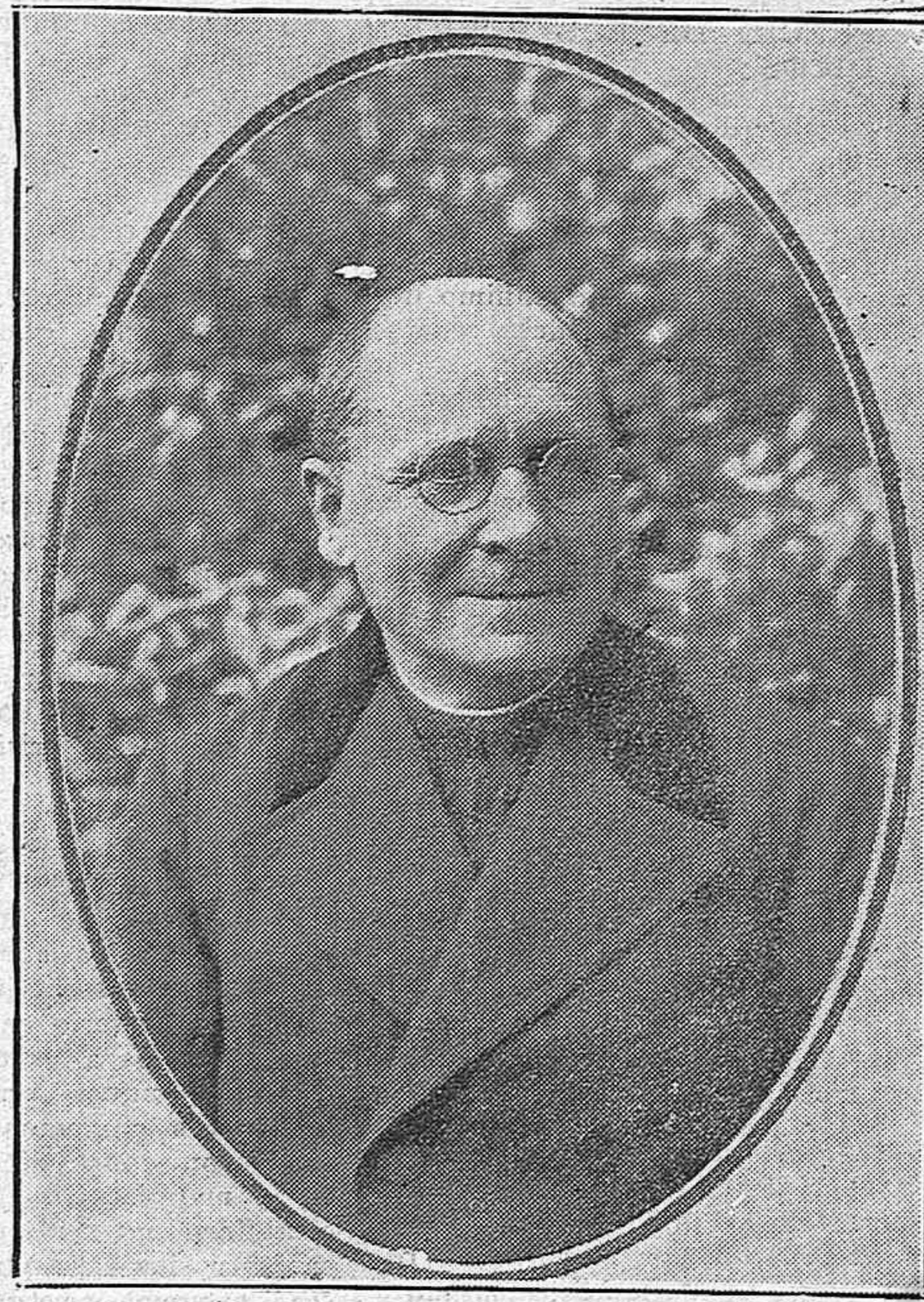
El rector del Seminario de Palencia, don Tomás Gutiérrez Díez, nuevo obispo de Burgo de Osma.

LEA USTED, MIERCOLES Y SABADOS, "EL AVISADOR NUMANTINO"