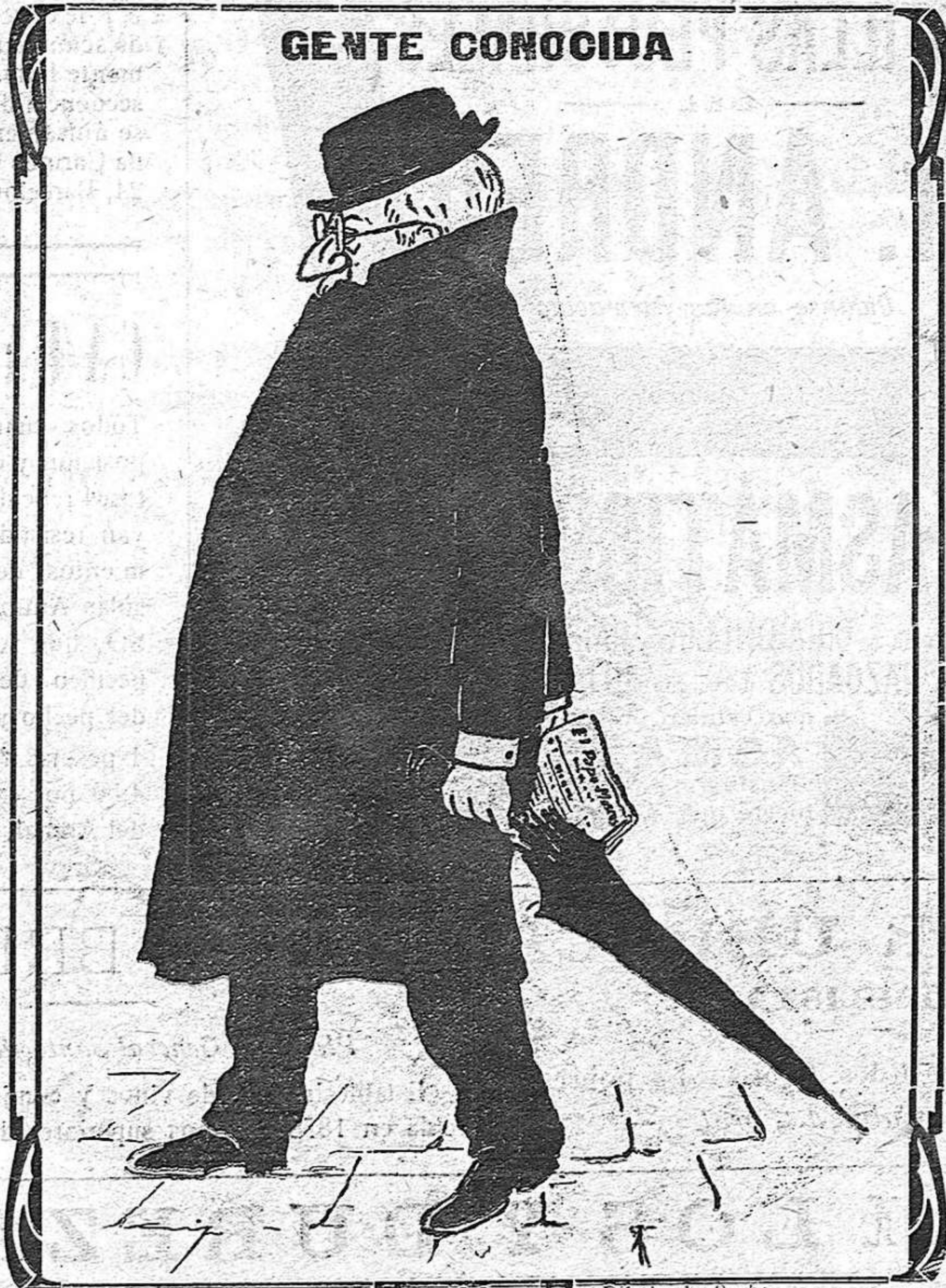
Dibujo de Barba.

De su claro talento la vasta enciclopedia espigó en los floridos campos de la comedia; sondeó de las ciencias el misterioso arcano; estudió en Las Partidas y glosó a Justiniano; dió luces refulgentes de potentes raudales