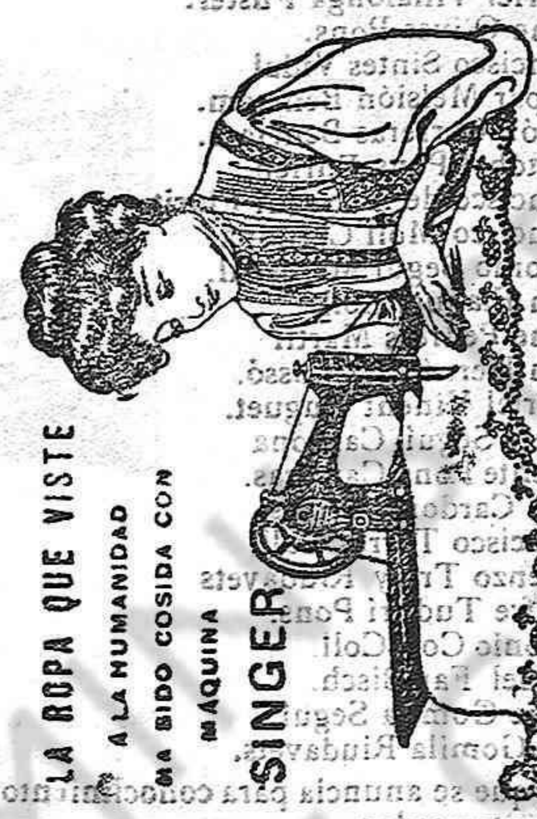
LA ROPA QUE VISTE A LA HUMANIDAD HA SIDO COSIDA CON MAQUINA SINGER

Para pasajes de 1.ª, 2.ª y 3.ª clase y carga, dirigirse a las oficinas de la Compañía: Estero Huguet, Plaza Príncipe, 13. MAHÓN: Estanco Timoner. ALAYOR: Sub-Agencia: Sebastián Seguí, Argumtbae 14 y 16. CIUDADELA: Sub-Agencia: DELA.