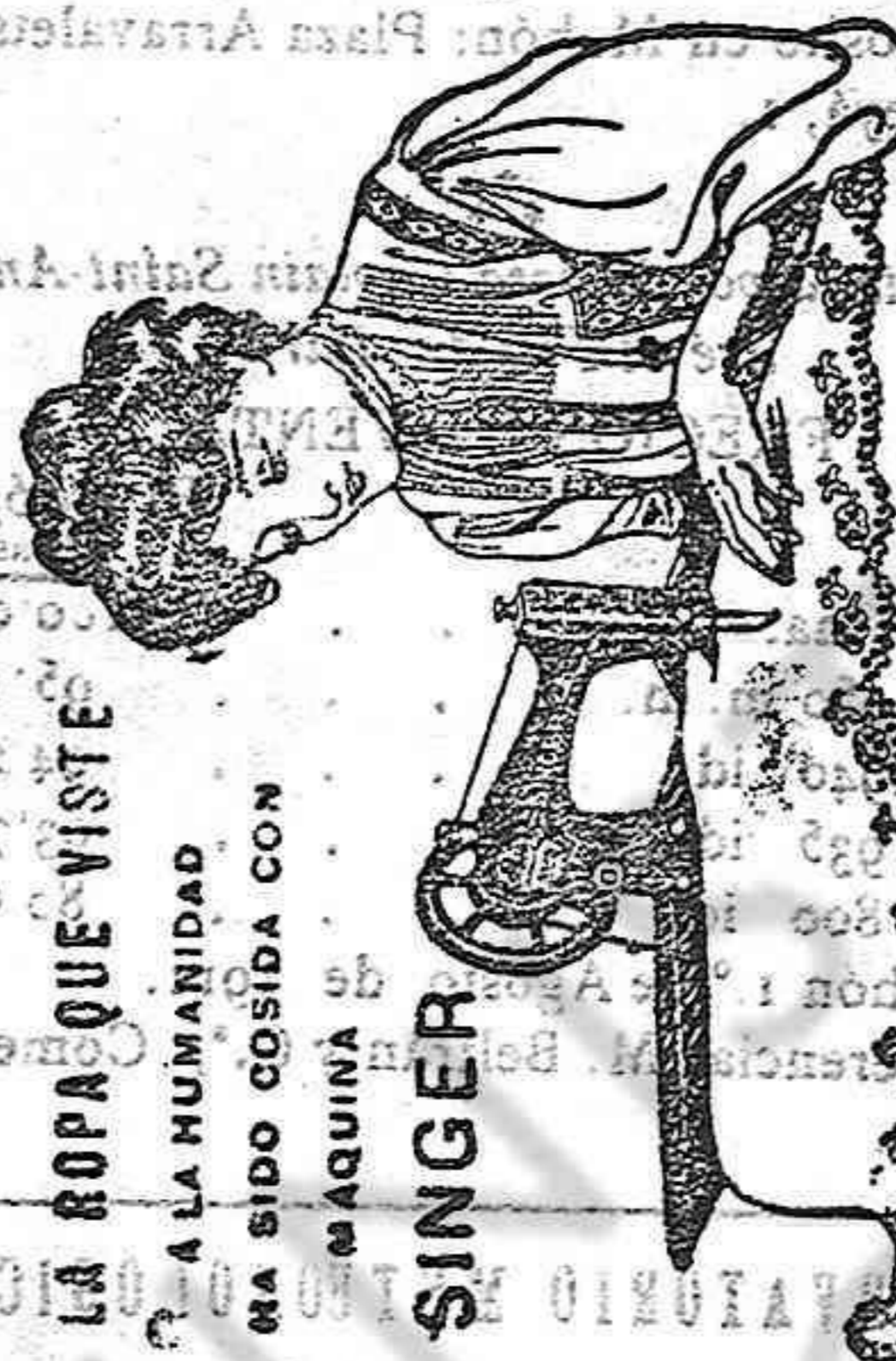
LA ROPA QUE VISTE