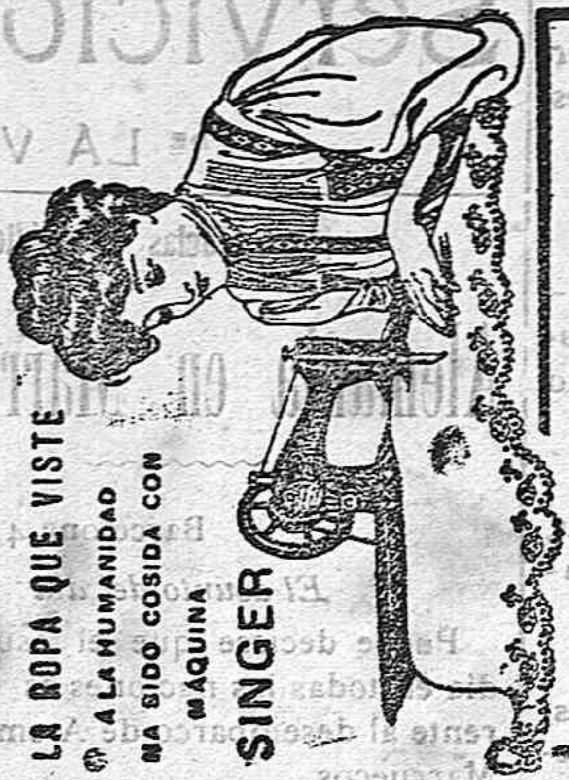
LA ROPA QUE VISTE A LA HUMANIDAD MA SÍDO COSIDA CON MAQUINA SINGER