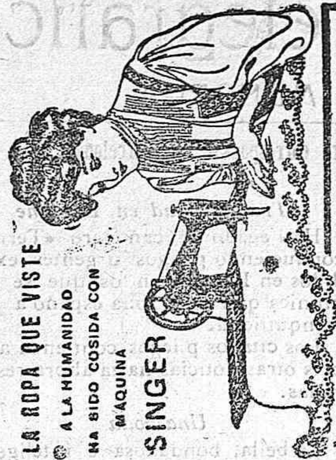
LA ROPA QUE VISTE A LA HUMANIDAD HA SIDO COSIDA CON MAQUINA SINGER

A los suscriptores se les hace un 25 por 100 de rebaja