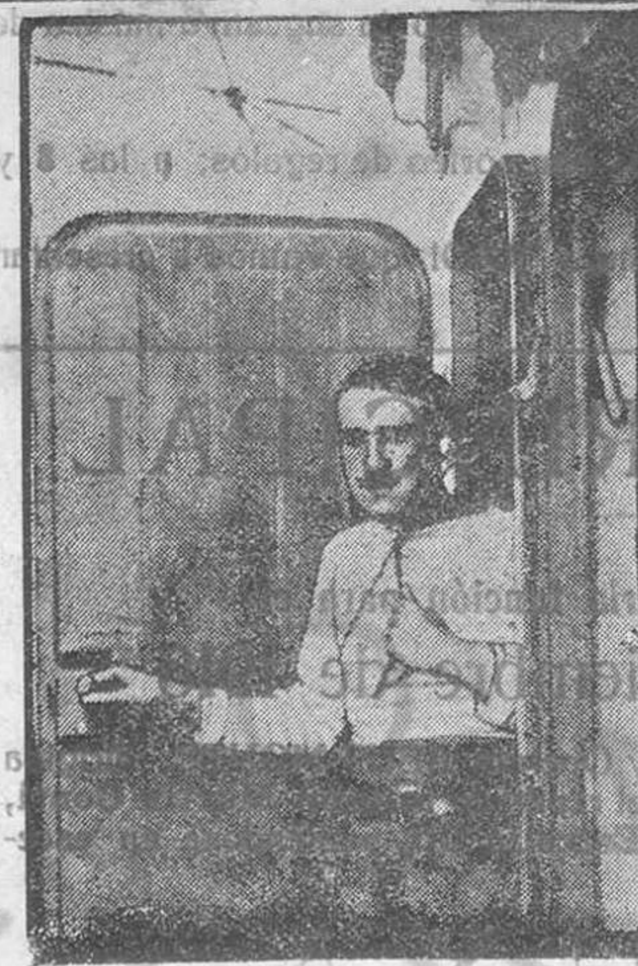
El teléfono a bordo