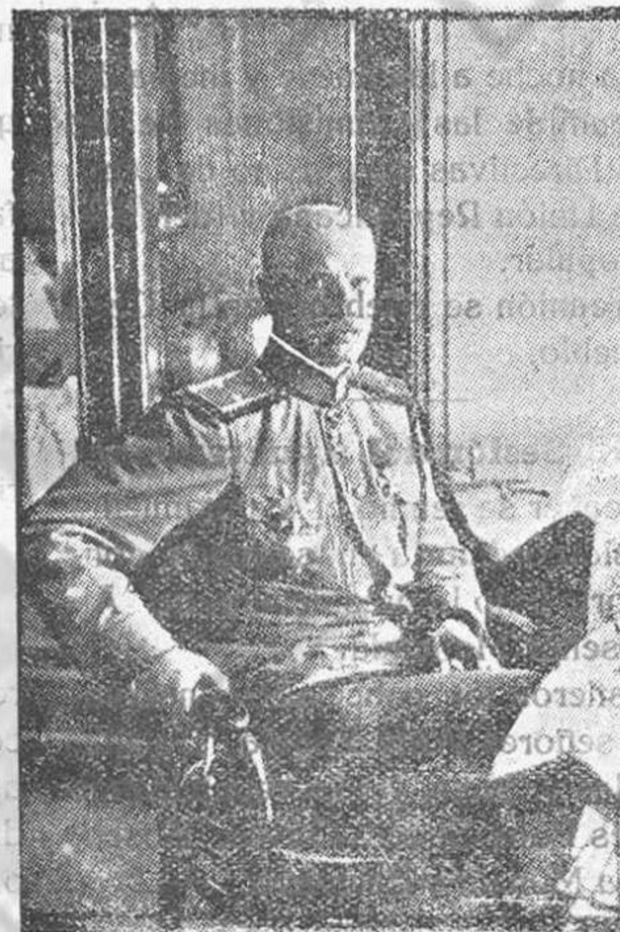
El General Lokwitsky, que manda las tropas rusas que combaten en Francia.

ha intervenido últimamente con eficacia: