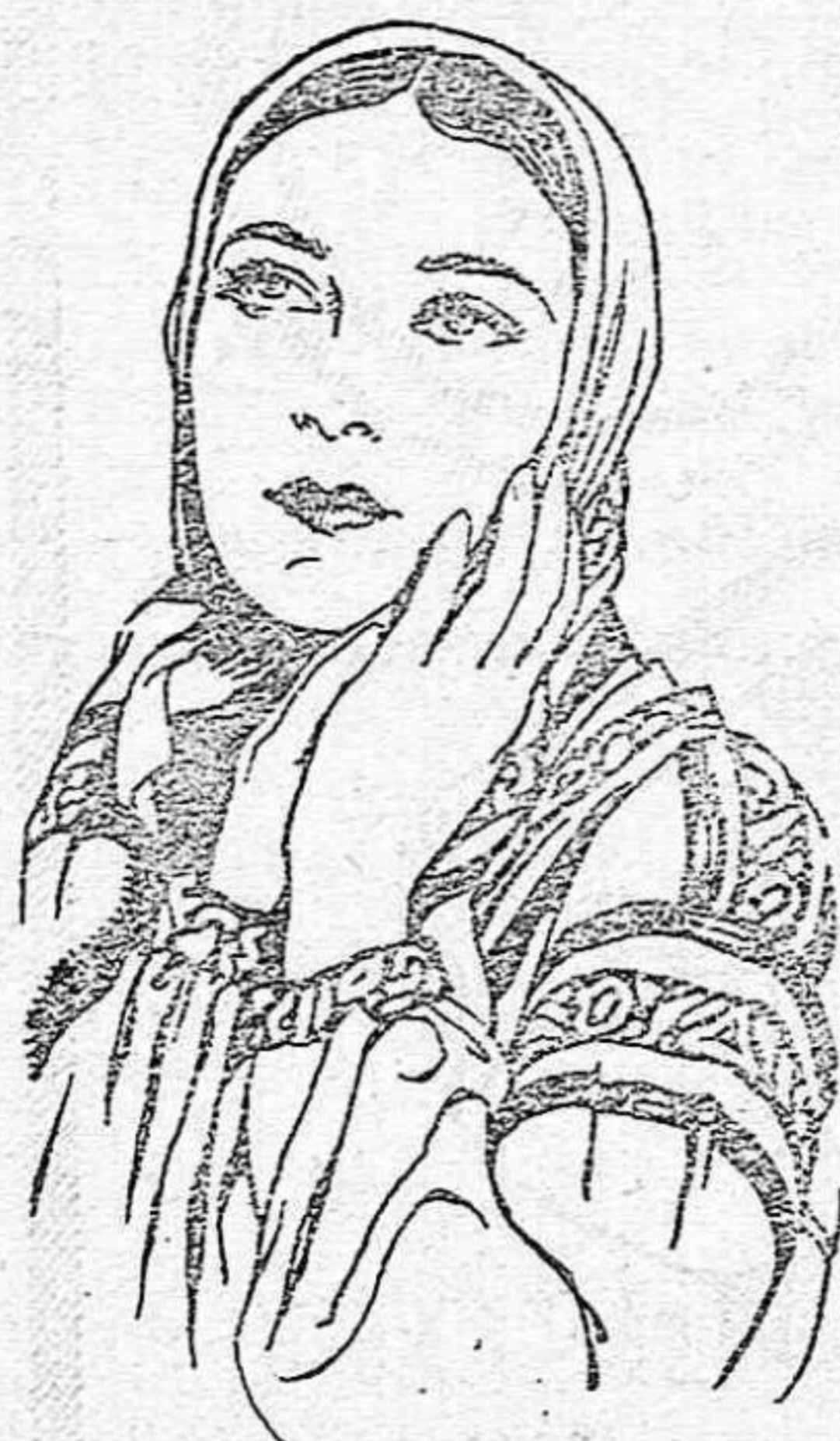
DOLORES DEL RIO

«RAMONA» es la película de argumento intenso que tanto le gusta a usted.