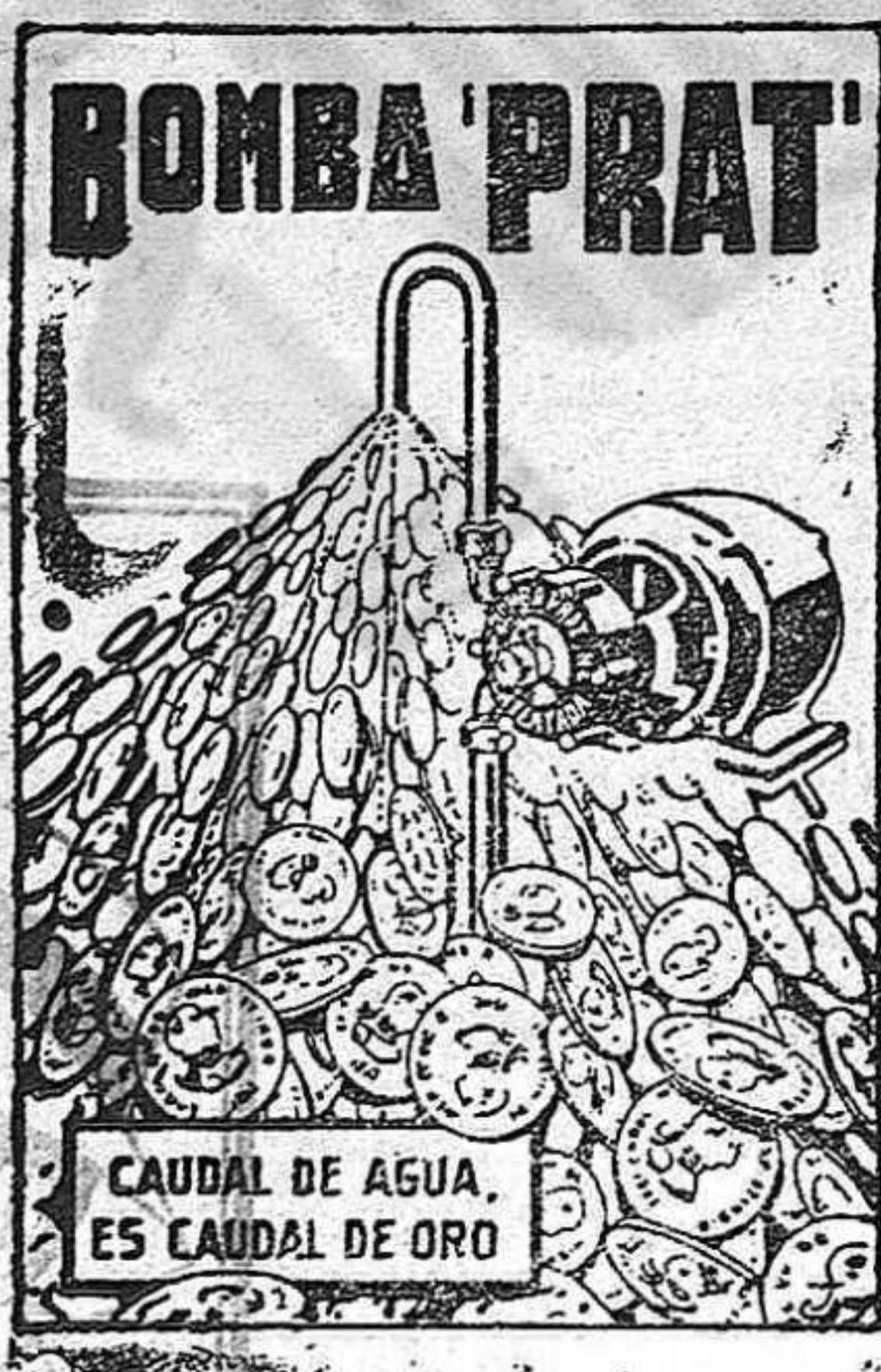
CAUDAL DE AGUA ES CAUDAL DE ORO

AGUA A COMODIDAD, SIN GASTES NI INTERRUPTIONES, Y CON UN CONSUMO DE FLUIDO INSIGNIFICANTE