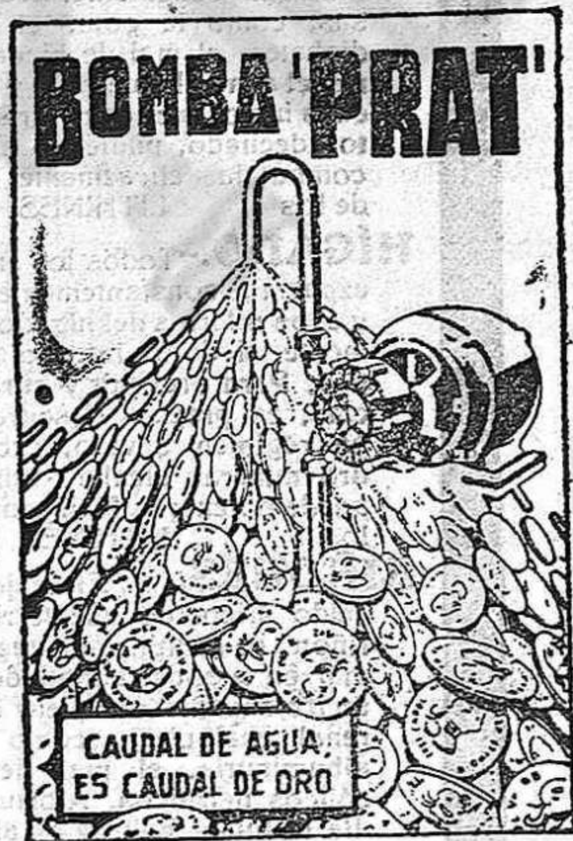
CAUDAL DE AGUA ES CAUDAL DE ORO

AGUA A JOI ODIDAD, SIN GASTES NI INTERRUPCIONES, Y CON UN CONSUMO DE FLUIDO INSIGNIFICANTE