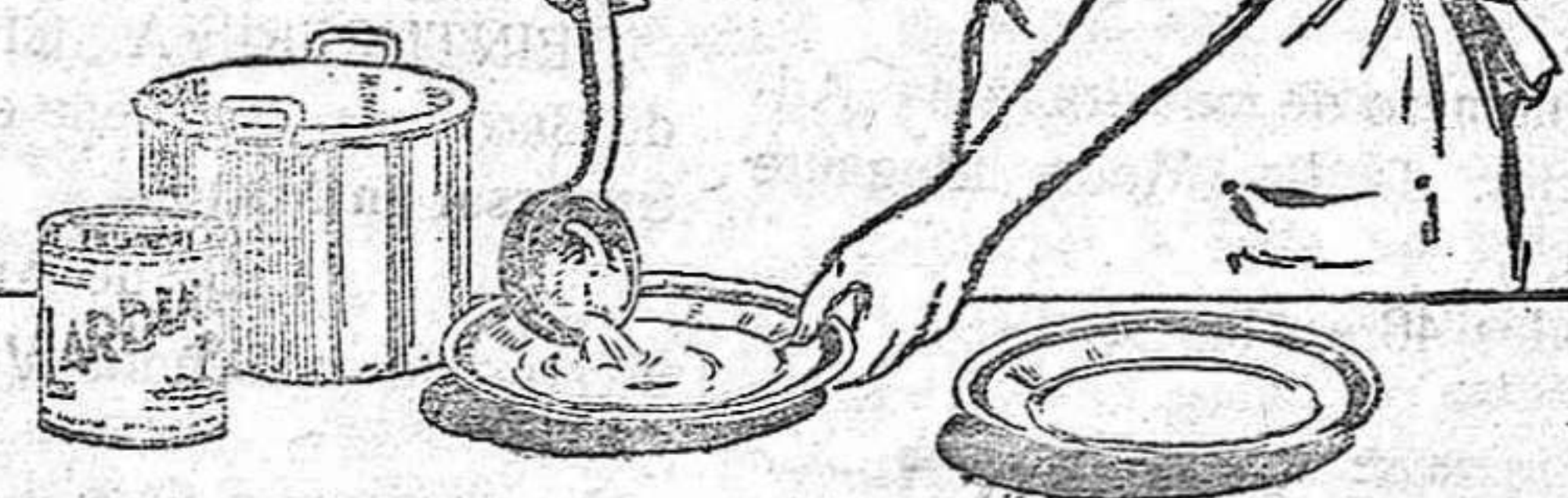
El Rey S. A. - CELTOS