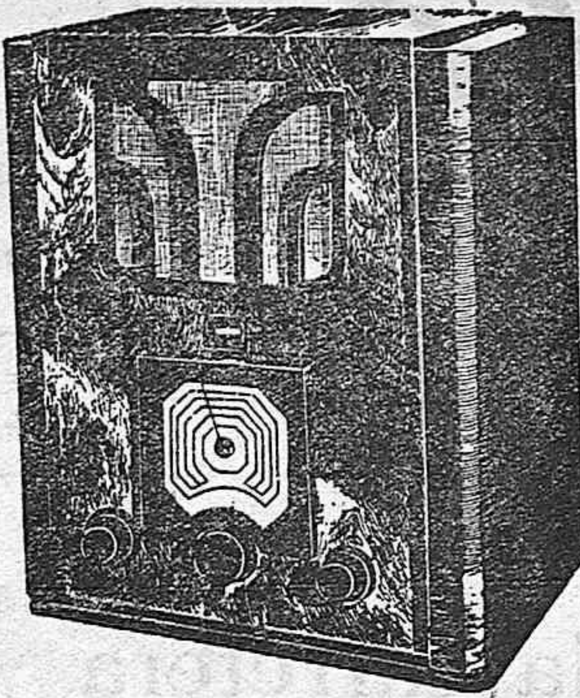
La llave del mundo Ptas. 1225 Cinco ondas