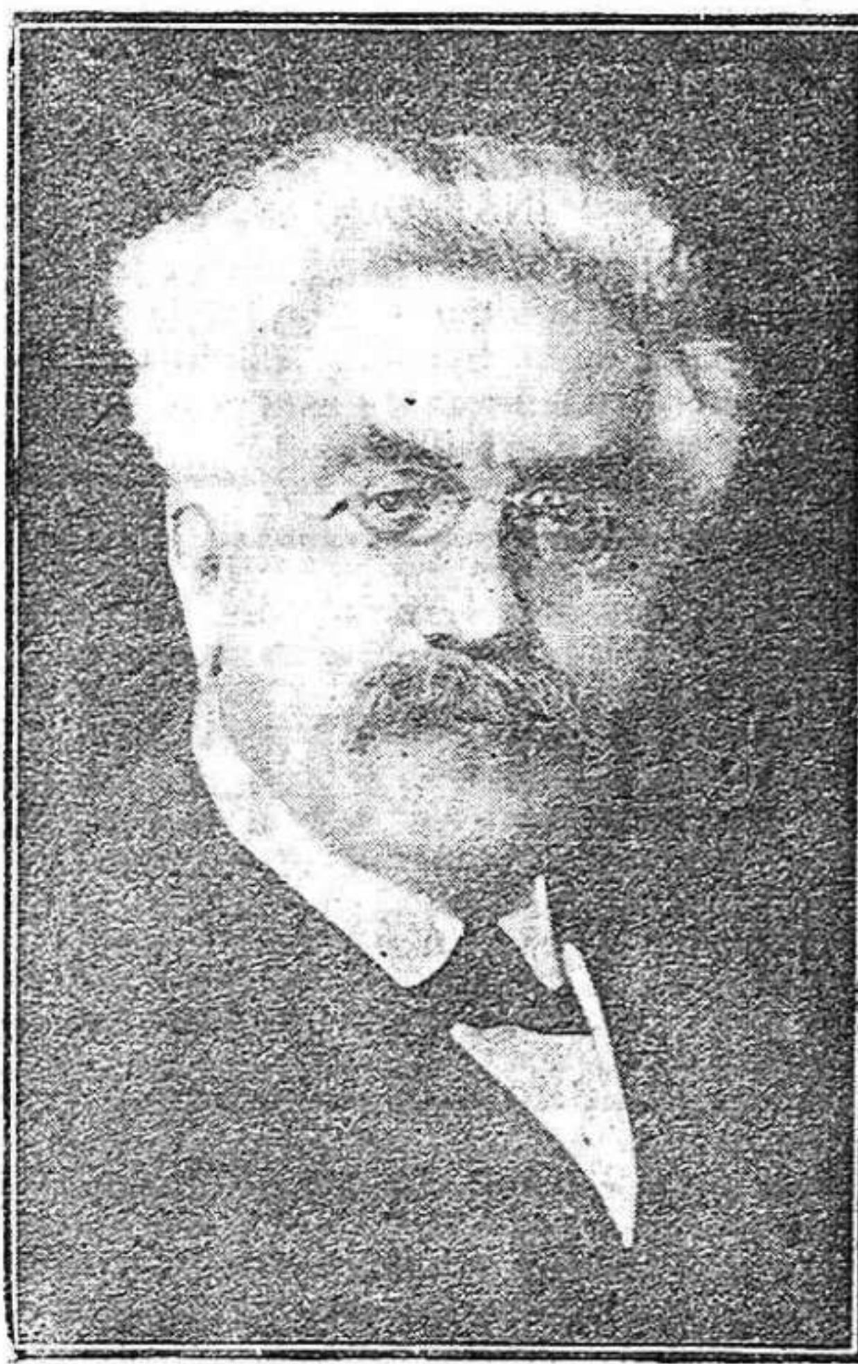
El presidente de la República francesa, Mr. MILLERAND, que ha presentado la dimisión de su alta magistratura.

rilizan durante 45 minutos, a 103 grados, con el autoclave o estufa de Hignette, que puede contener 1.000 biberones.