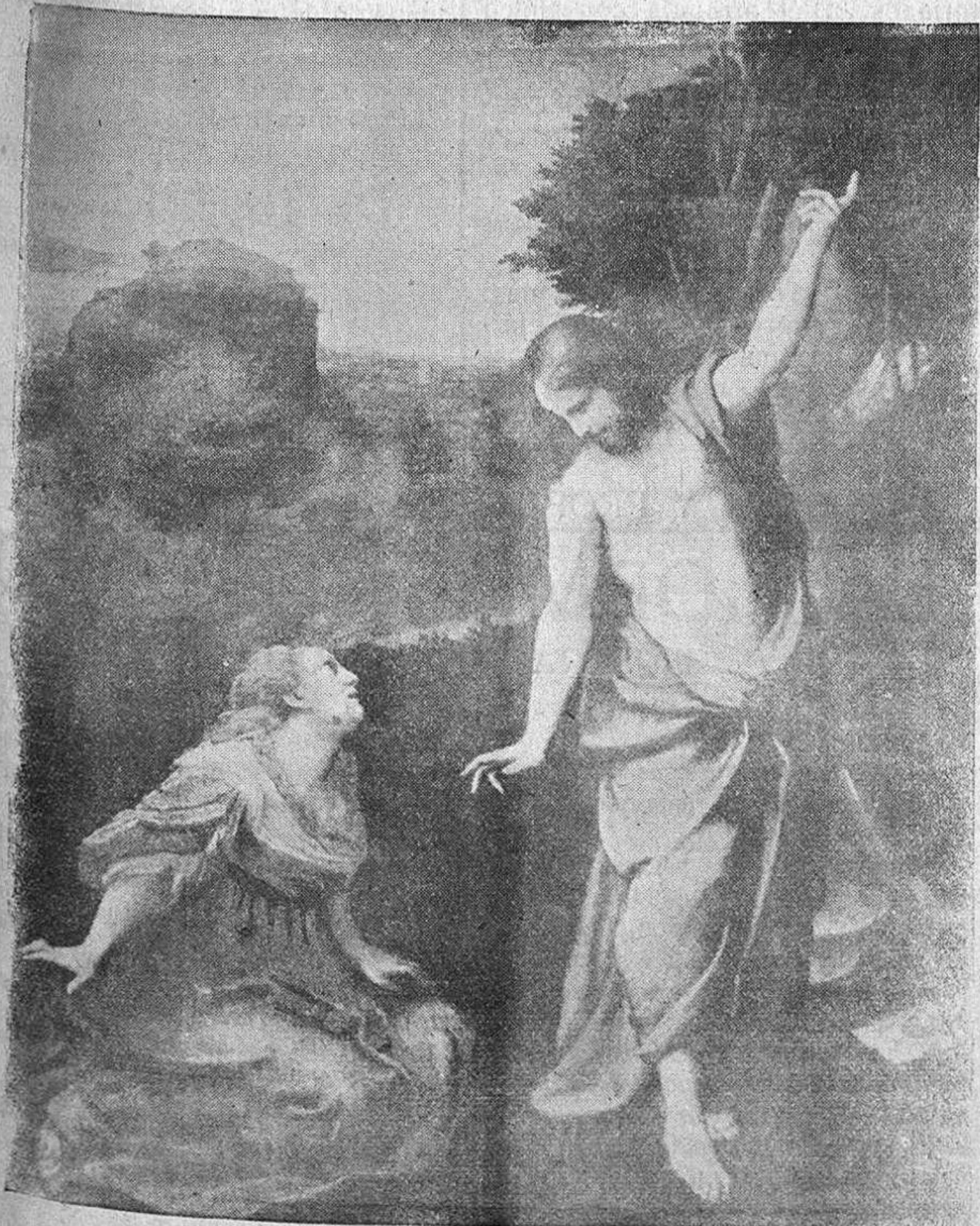
NOLI ME TANGERE

Y andando, andando, un día llegaron a Bethania.