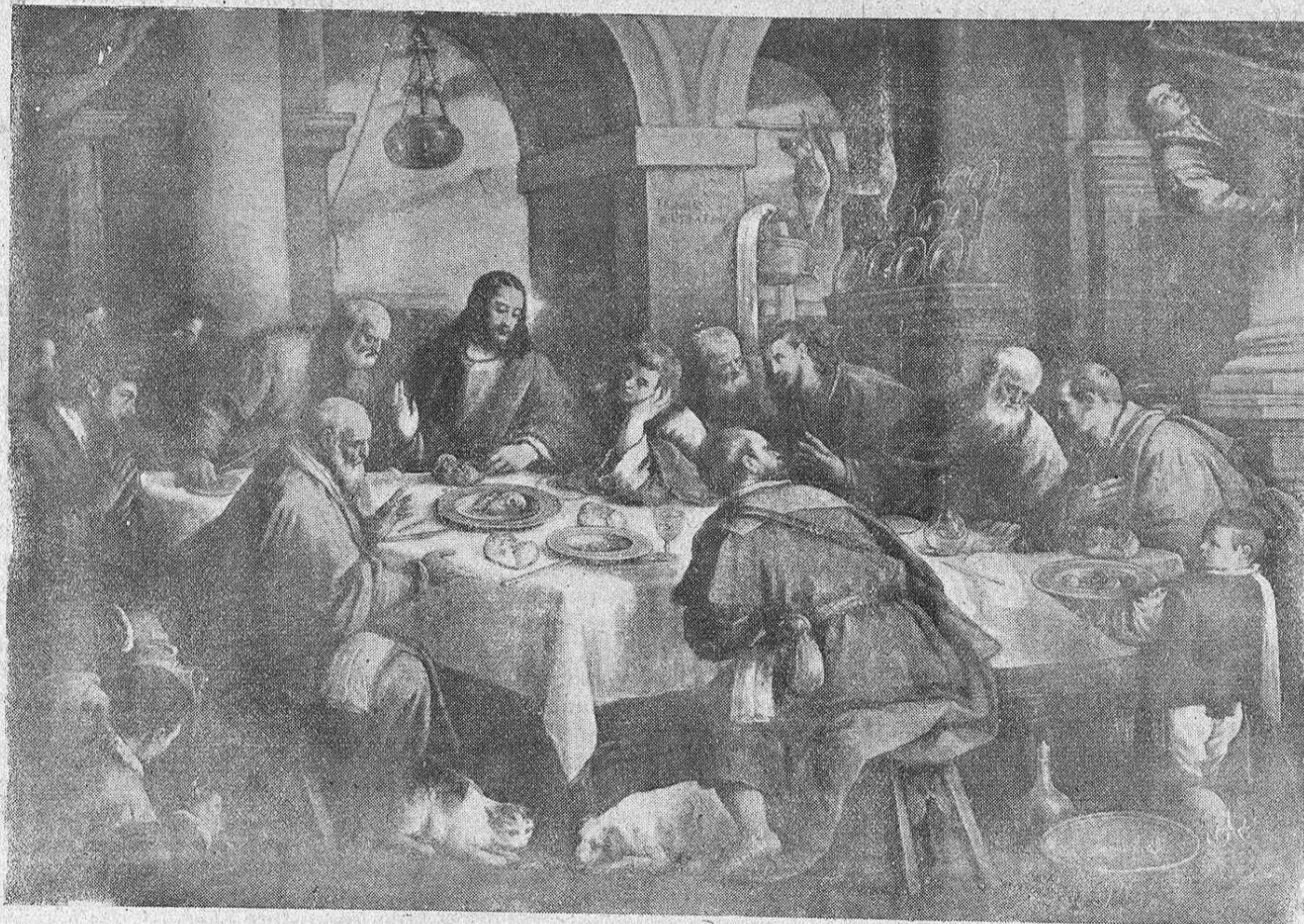
Reproducción del famoso lienzo del Bassano

tener con su amenaza violenta y trágica, el paso del buque que sobre ellas se asentaba atrevido con el gesto desdeñoso del que hace pesar sobre el vencido toda la grandeza de su poder.