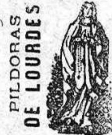
PÍLDORAS DE LOURDES