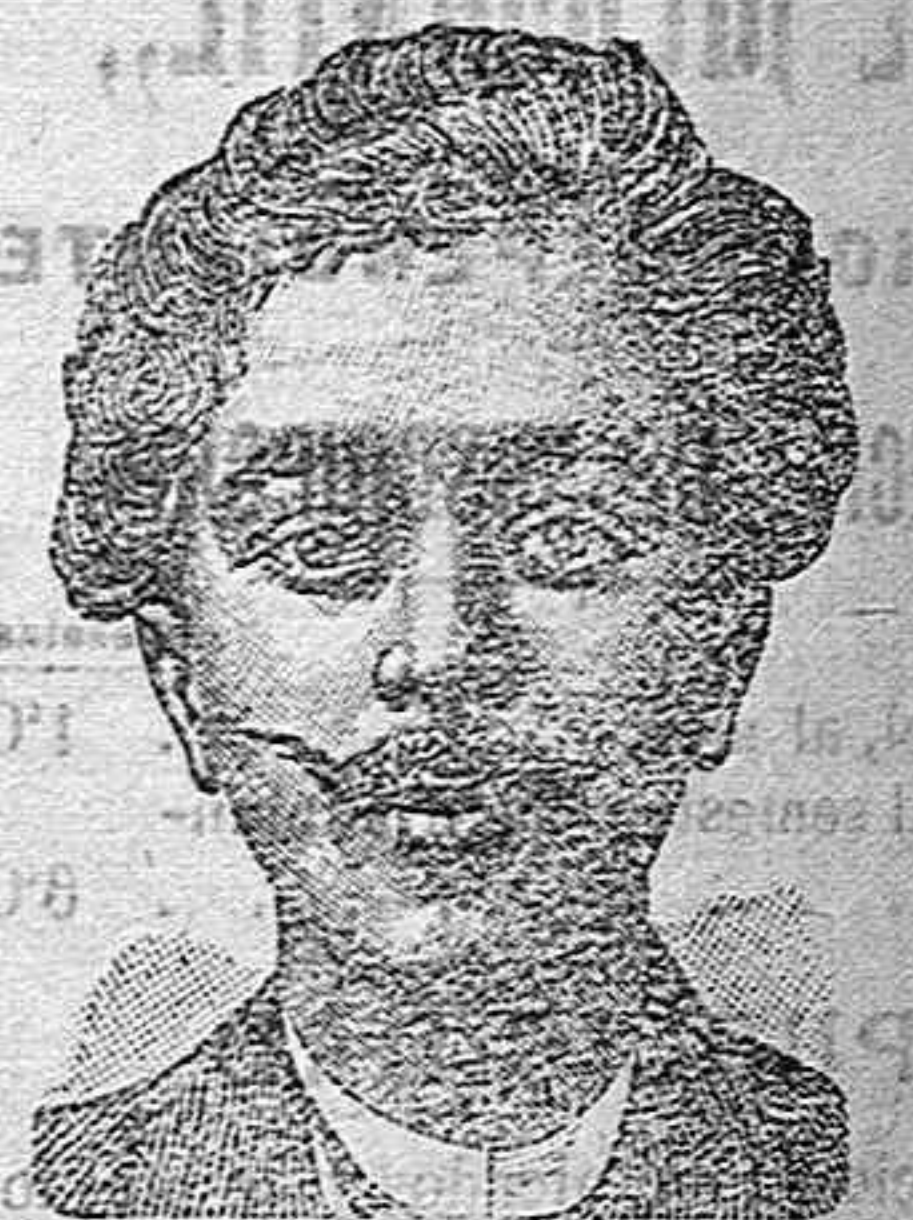
Después de 15 días de curación