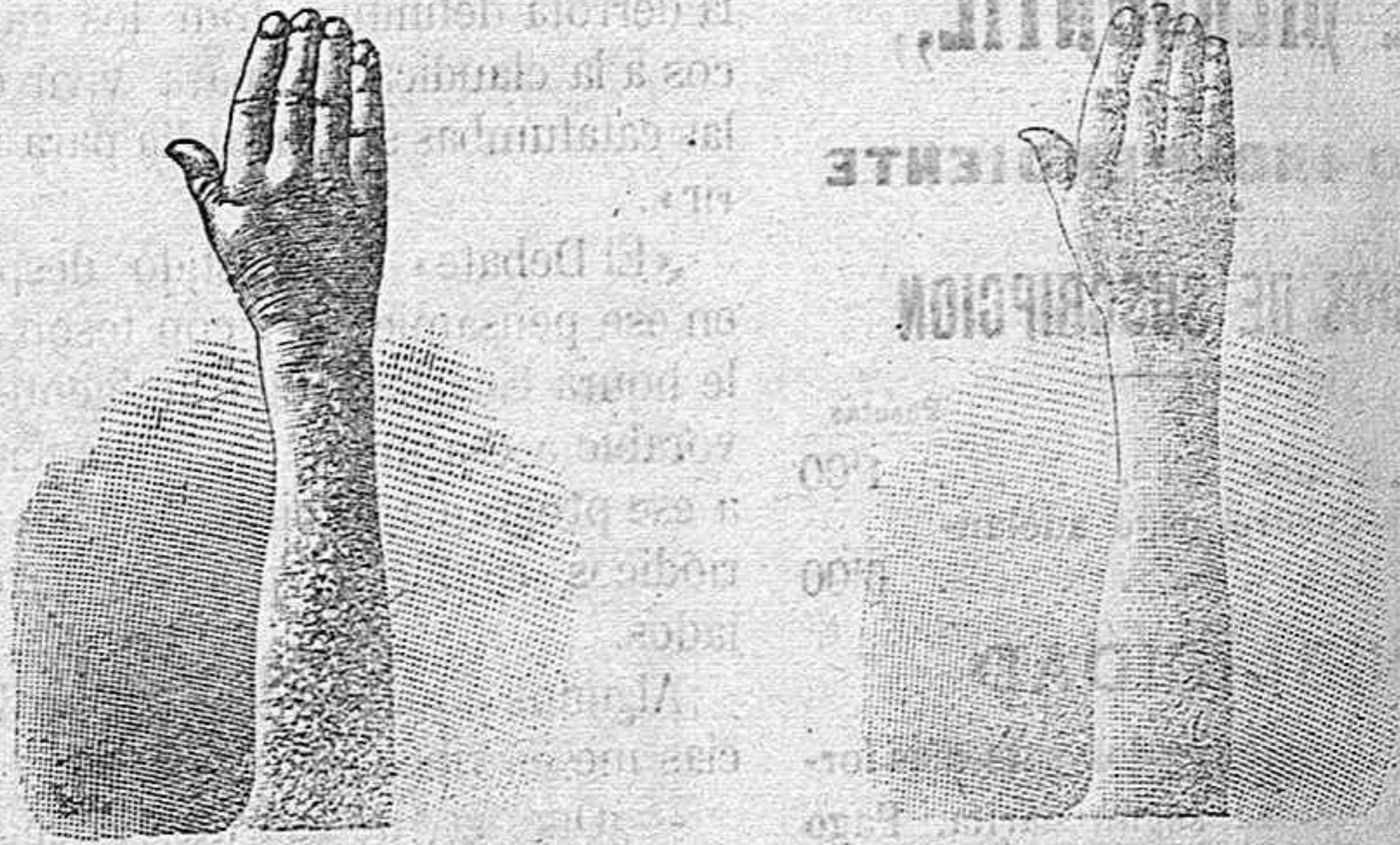
Antes de la curación. Después de 10 días de curación

curación radical de todas las enfermedades de la piel y laspias y del artrismo, reumatismo, gota, dolores etc. per medio del TRATAMIENTO DEL RICHELET