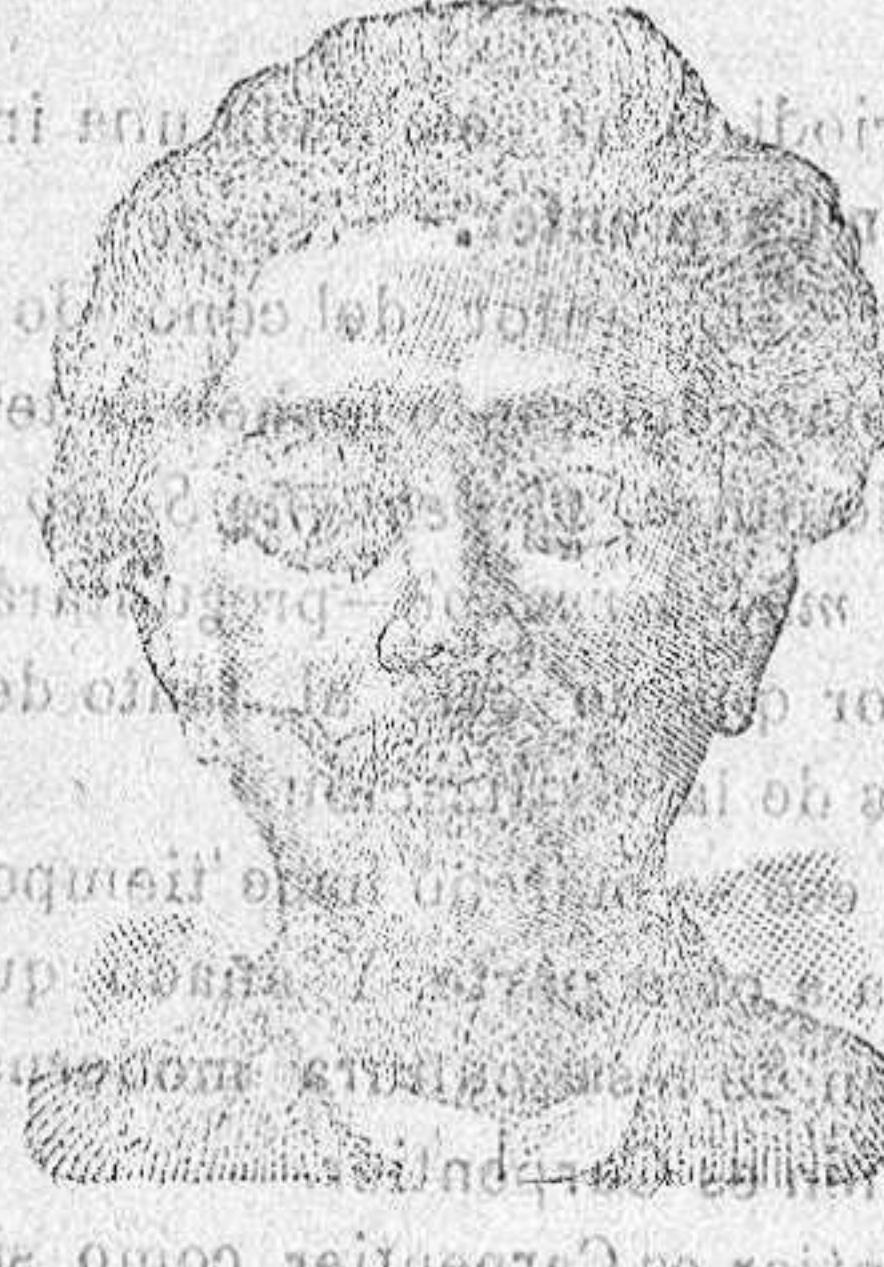
Después de 15 días de curación