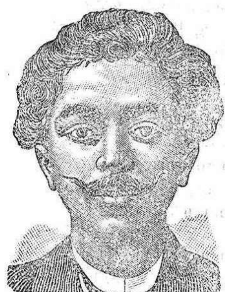
Después de 15 días de la curación