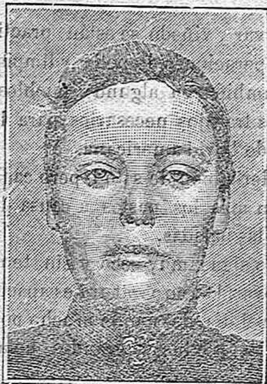
Después de 10 días de curación