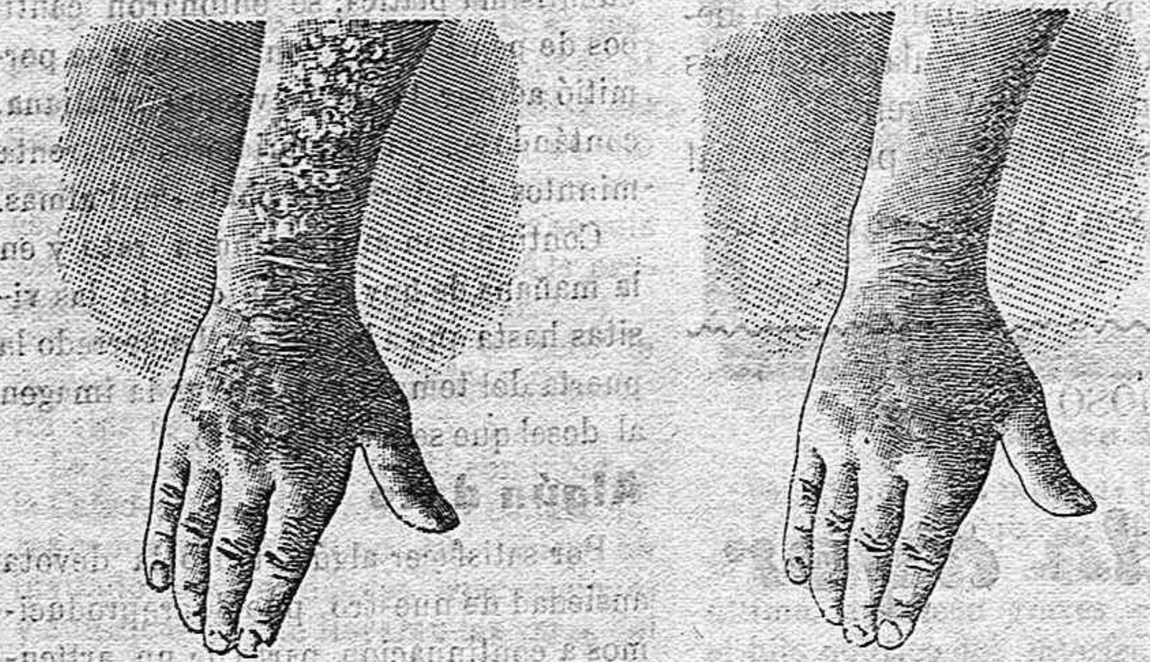
Antes de la curación. Después de 15 días de curación