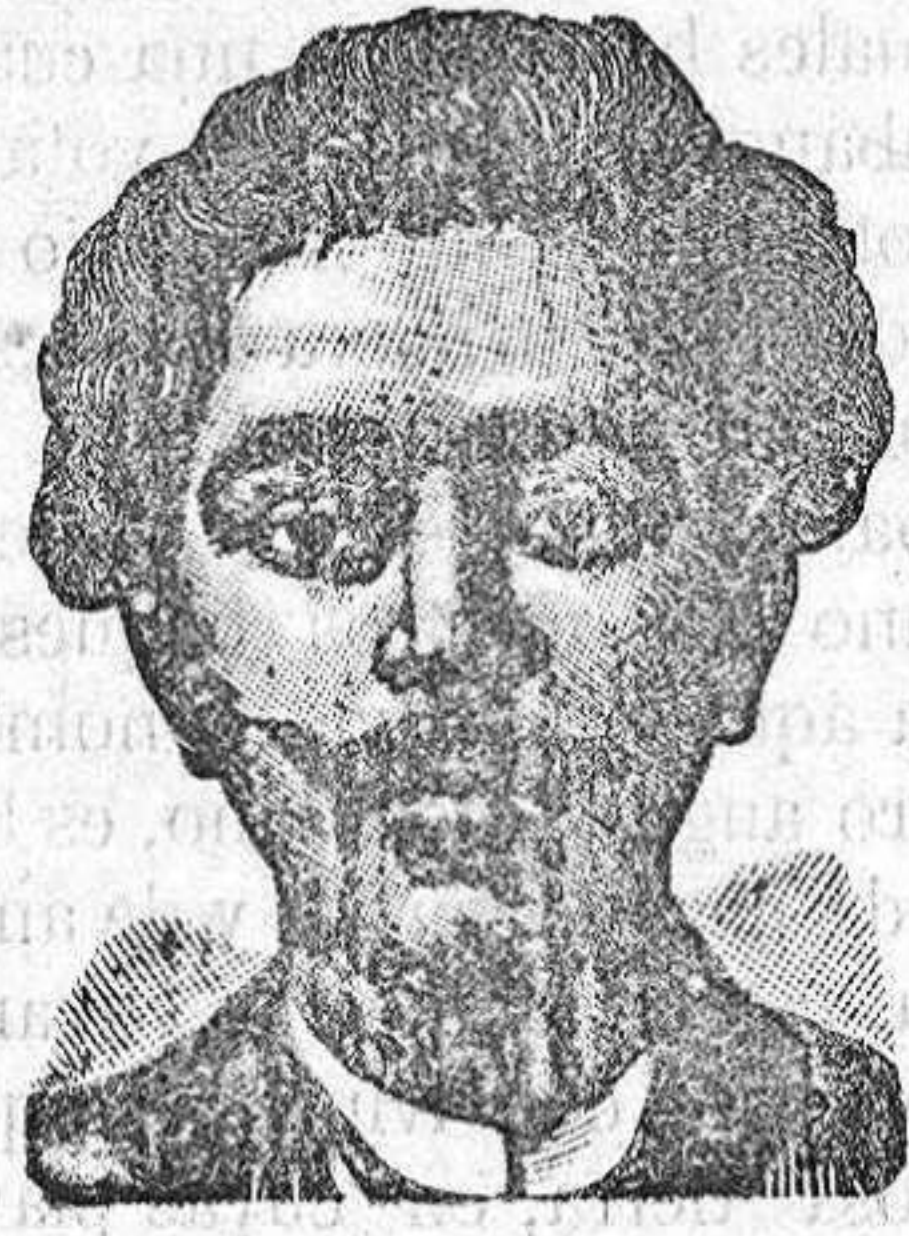
Después de 10 días de curación