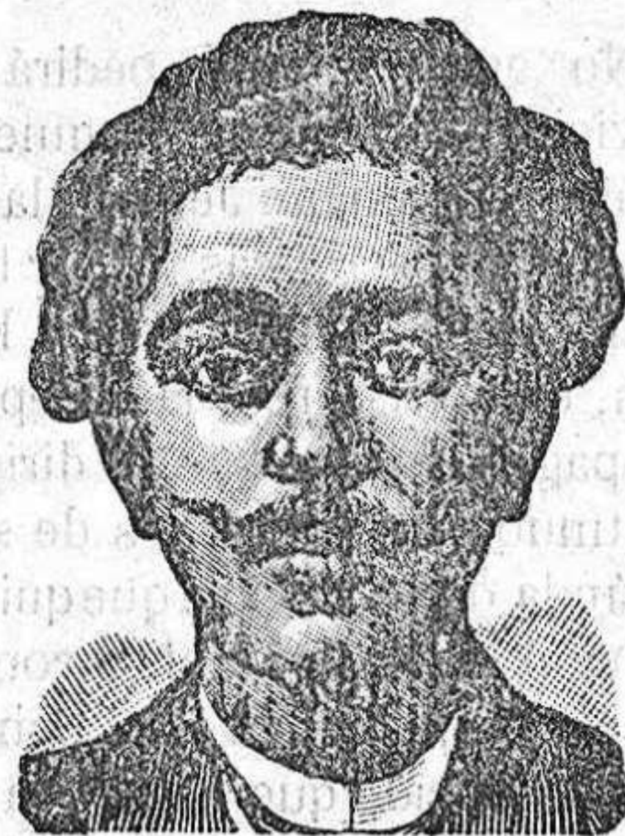
Después de 10 días de curación