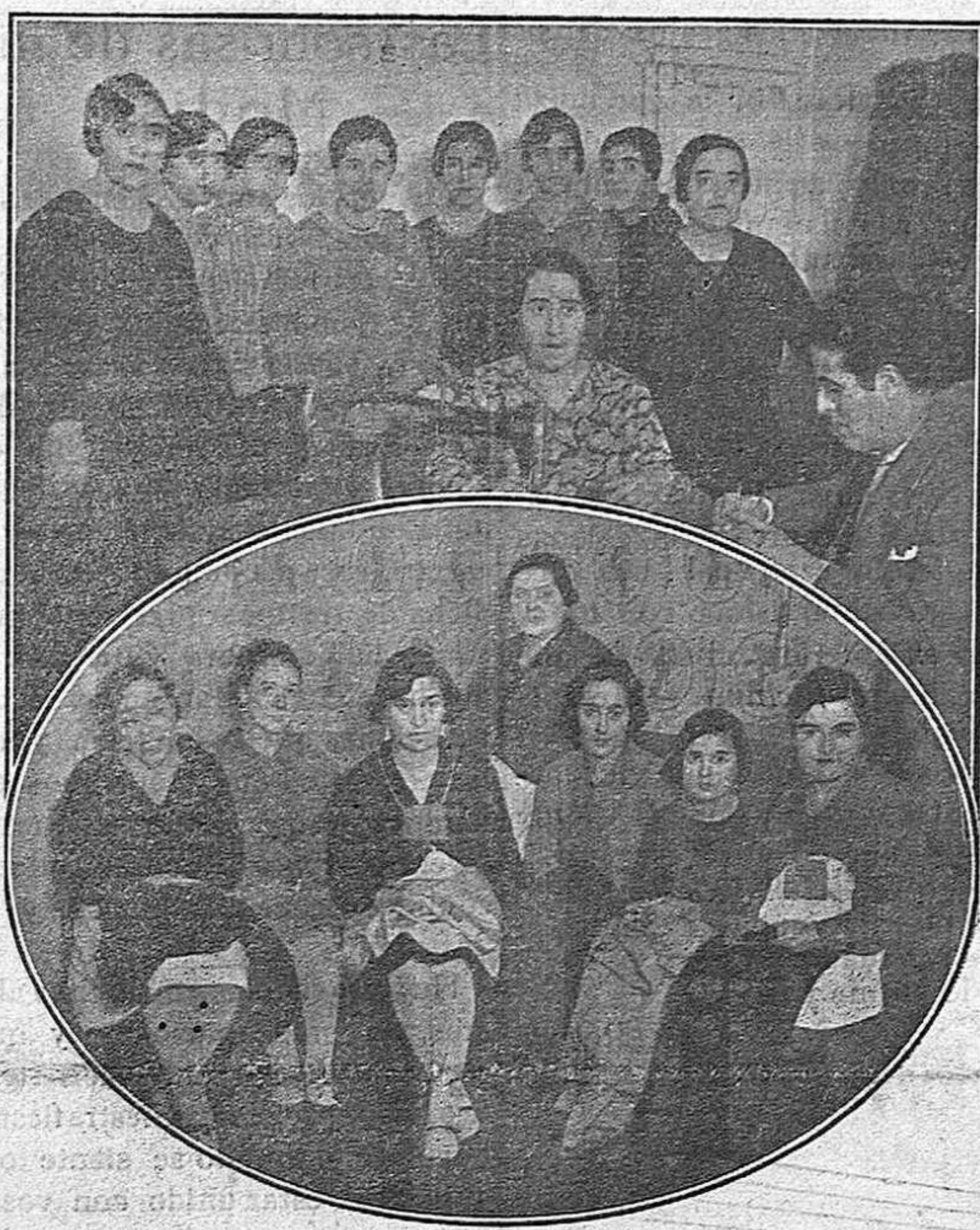
Grupos de bellas modistillas turolenses, que hoy celebran su fiesta