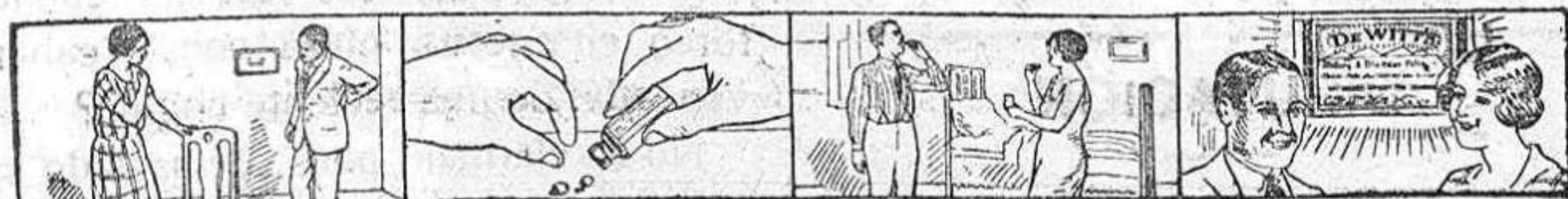
Para librarse de Dolor de Espalda--

Unas horas después de haber tomado la primera dosis de Píldoras De Witt el cambio de color de la orina le dará a comprender que la preparación ya ha principiado su buena obra. Estará Vd. en condiciones de observar que los ingreientes limpiadores, curativos y fortalecientes de las Píldoras De Witt han pasado a través de sus Riñones y Vejiga. No existe otro medicamento que le dé una prueba parecida, y cuando haya Vd. ensayado las Píldoras De Witt se arrepentirá de que no las hubiera tomado antes. Tómeles para Dolores urticantes, Artritis, Calculos, Copulaciones doloridas, Rigidez, Reumatismo, Dolores en la Espalda, Lumbago y Ciática . Délas a los niños que están predispuestos a orinarse en la cama y a las personas adultas afectadas por Desórdenes Urinarios , y en todos los casos causarán alivio rápido y serán de efectos duraderos.