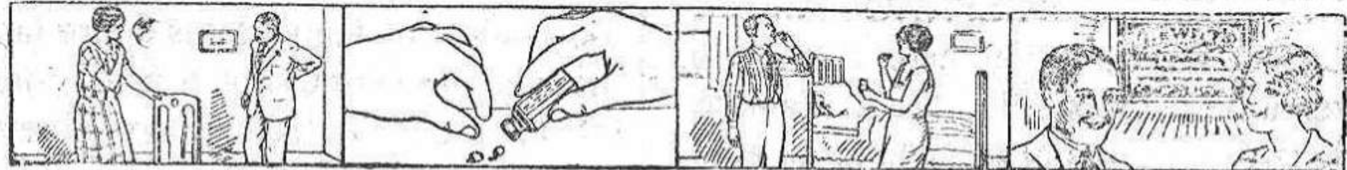
para librarse de Reumatismo

Una hora después de haber tomado la primera dosis de Píldoras De Witt el cambio de color de la orina le dará a entender que la preparación ya ha principiado su buena obra. Estará Vd. en condiciones de observar que los ingredientes limpiadores, curativos y fortalecedores de las Píldoras De Witt han pasado a través de sus Riñones y de su Vejiga. No existe otro medicamento que le dé una prueba parecida, y cuando haya Vd. ensayado las Píldoras De Witt se arrepentirá del hecho de que no las hubiera tomado antes. Tómelas para Dolores ardientes, Artritis, Cálculos, Concretos, doloridas, Rigidez, Reumatismo, Dolores en la Espalda, Lumbago y Cistitis. Haga Vd. que las tome los niños que están predispuestos a Orinarse en la Cama y las personas adultas afectadas por Desórdenes Urinarios, y en todos los casos causarán alivio rápido y serán de efectos duraderos.