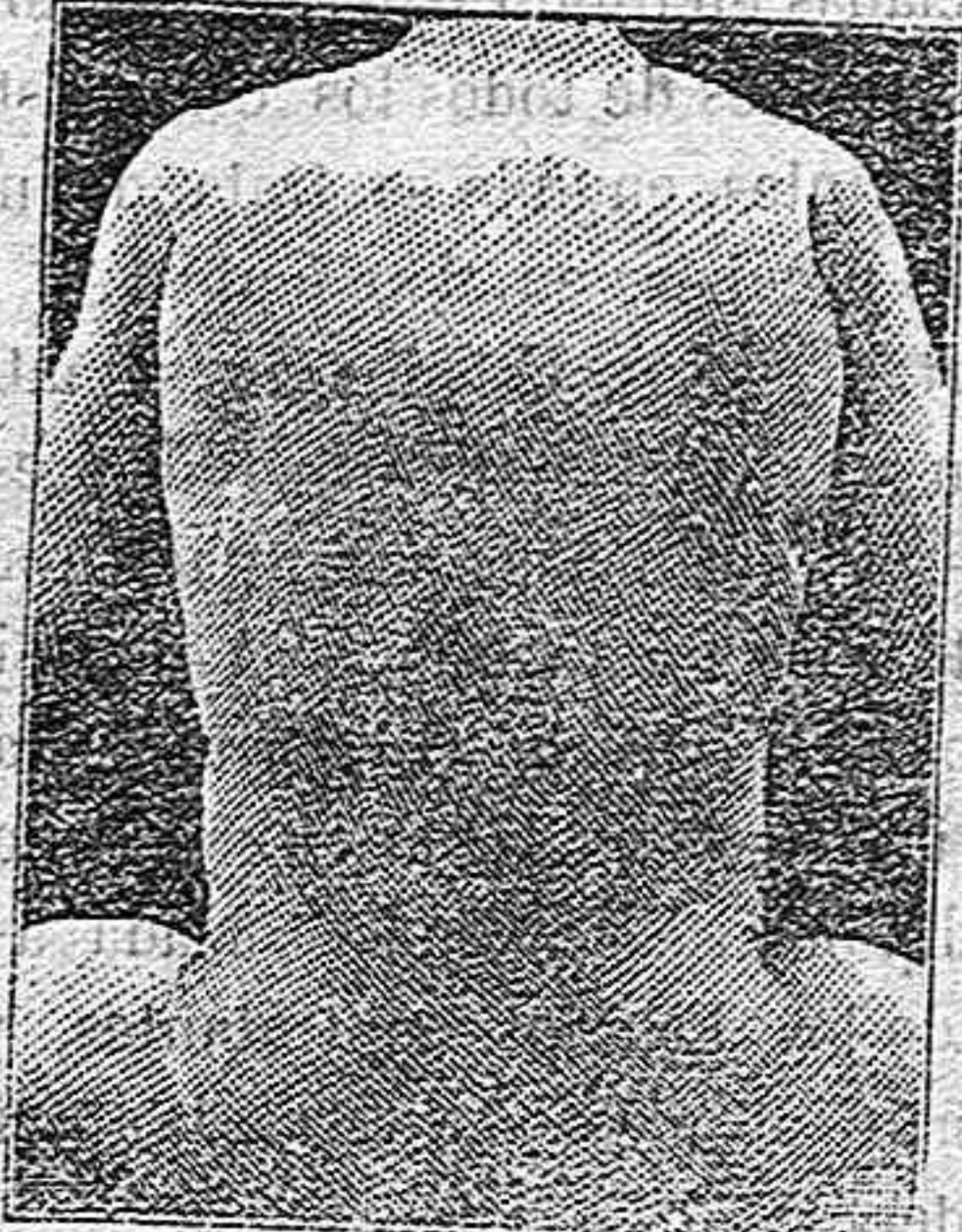
Después de 60 días de curación