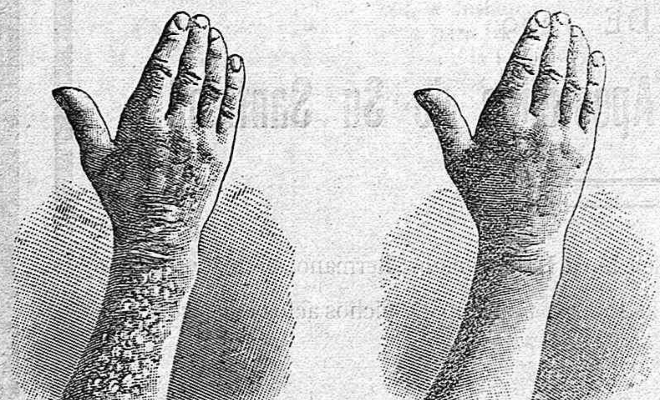
Antes de la curación Después de 10 días de curación

curación radical de todas las enfermedades de la piel, de las llagas de las piernas y del artrismo, reumatismo gota, dolores, etc. por medio del TRATAMIENTO DE L. RICHELET