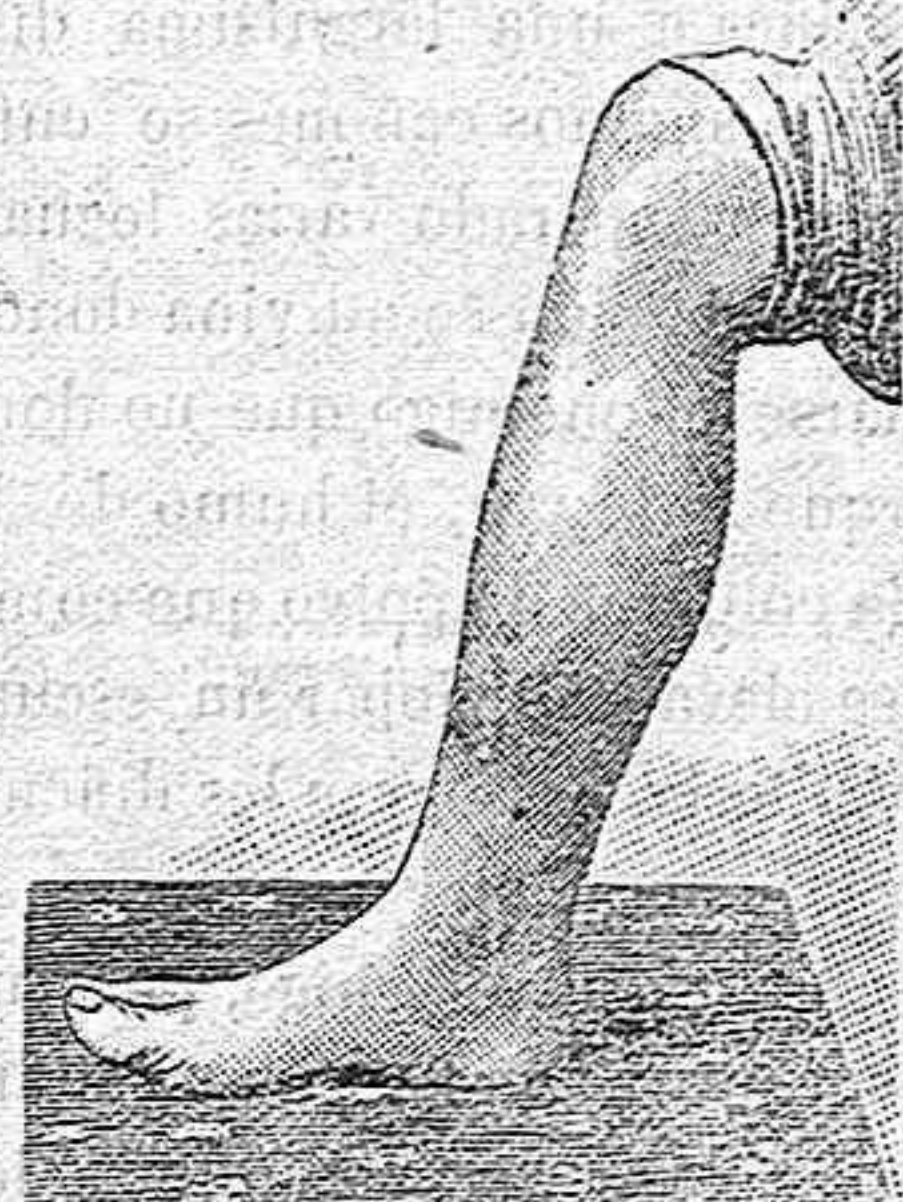
Después de 10 días de curación