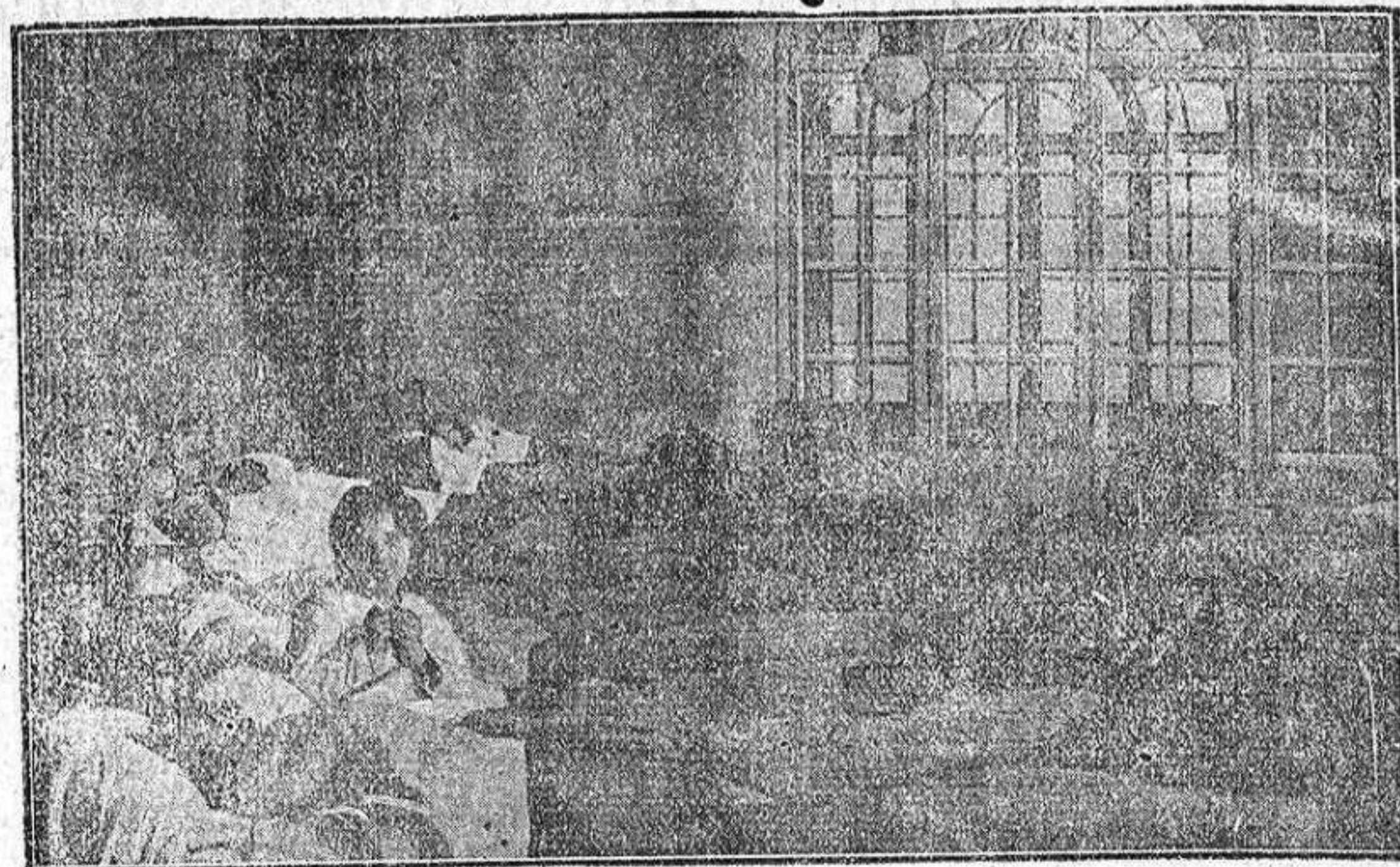
UN EPISODIO DE LA CINTA «LA ALONDRA Y EL MILANO»