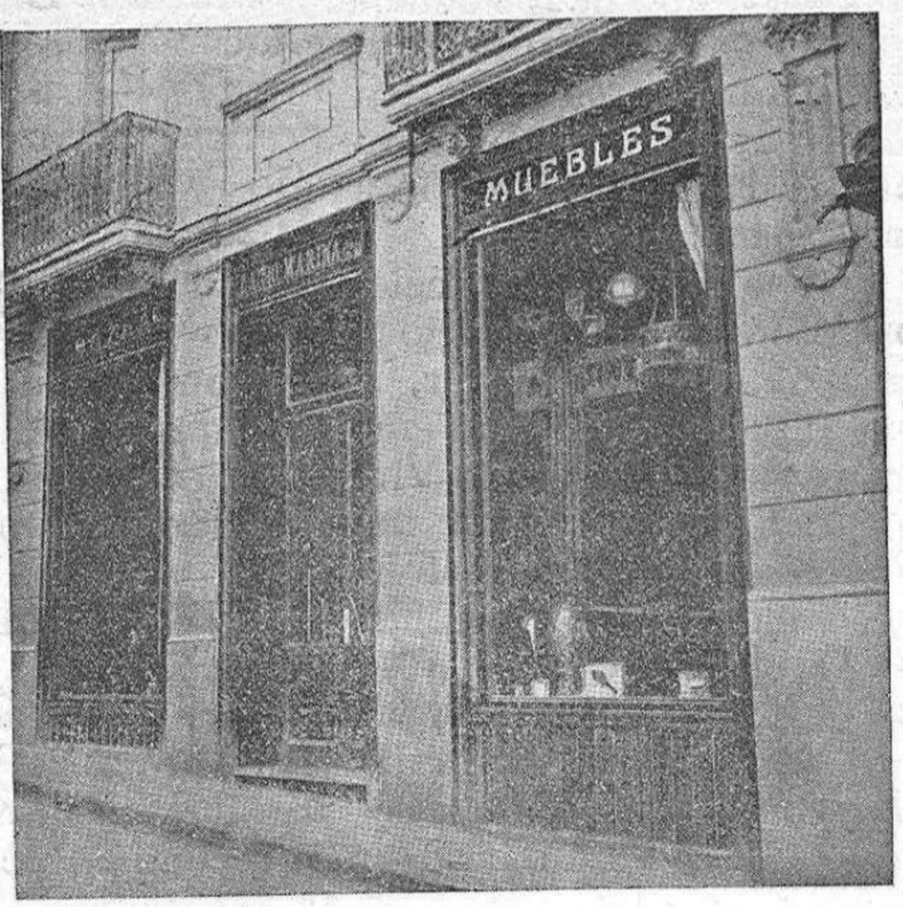
Vista exterior de este establecimiento