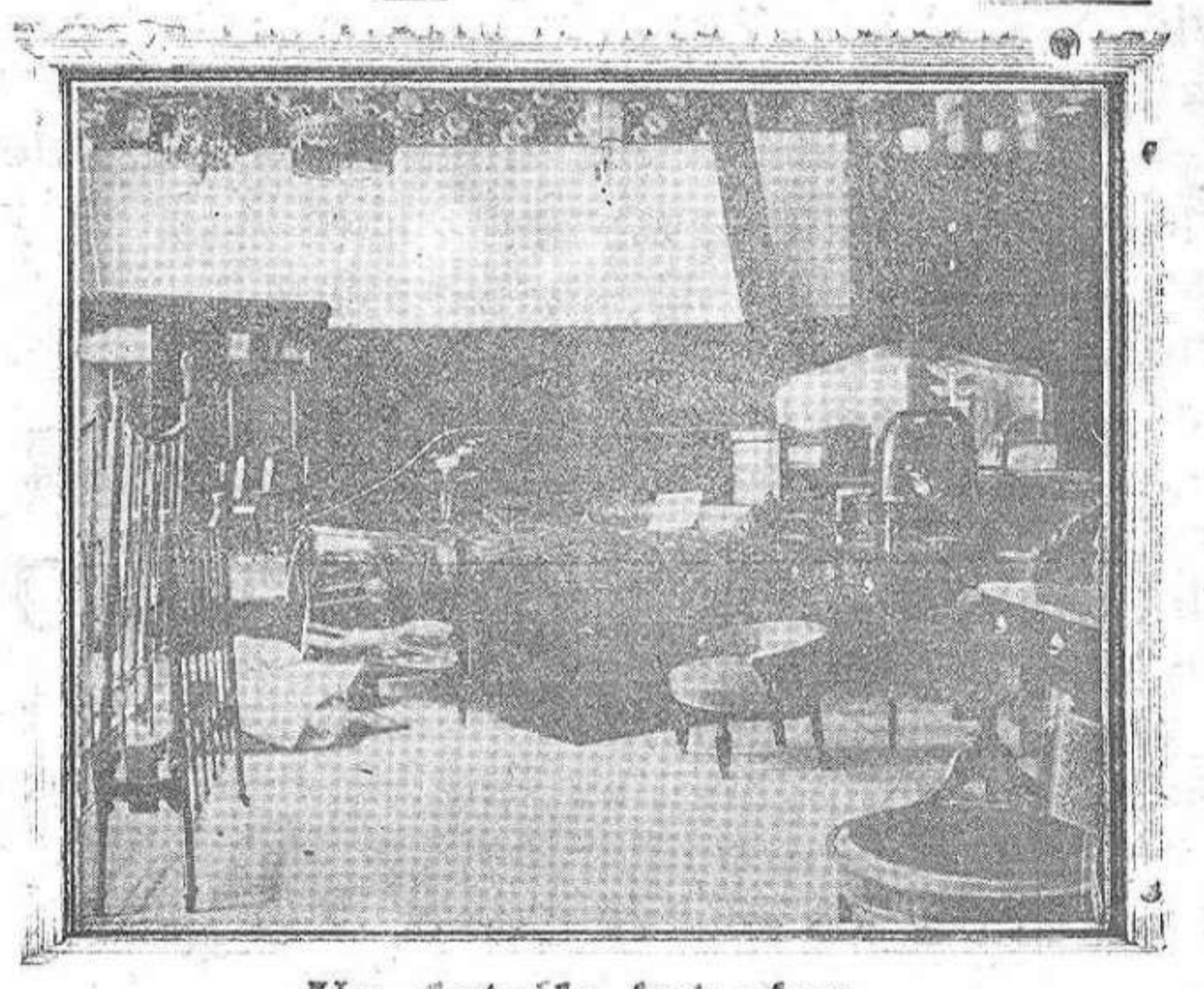
Un detalle interior

Fíjese en nuestros APARATOS DE LUZ y OBJETOS PARA REGALOS