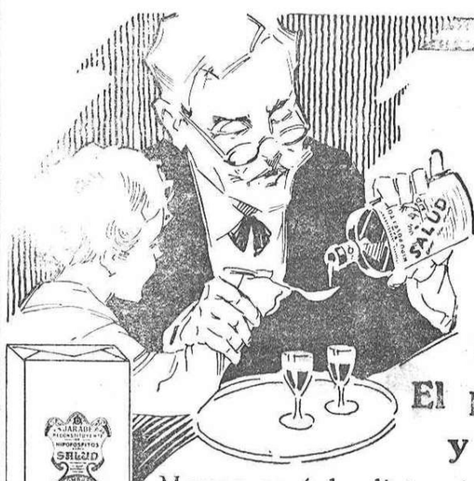
El príncipe y el ferret

Mayor será la distancia que la infancia y la vejez cuando se lea y mantenga el vigor y la pureza de la sangre a través de los años con el potente Jarabe de