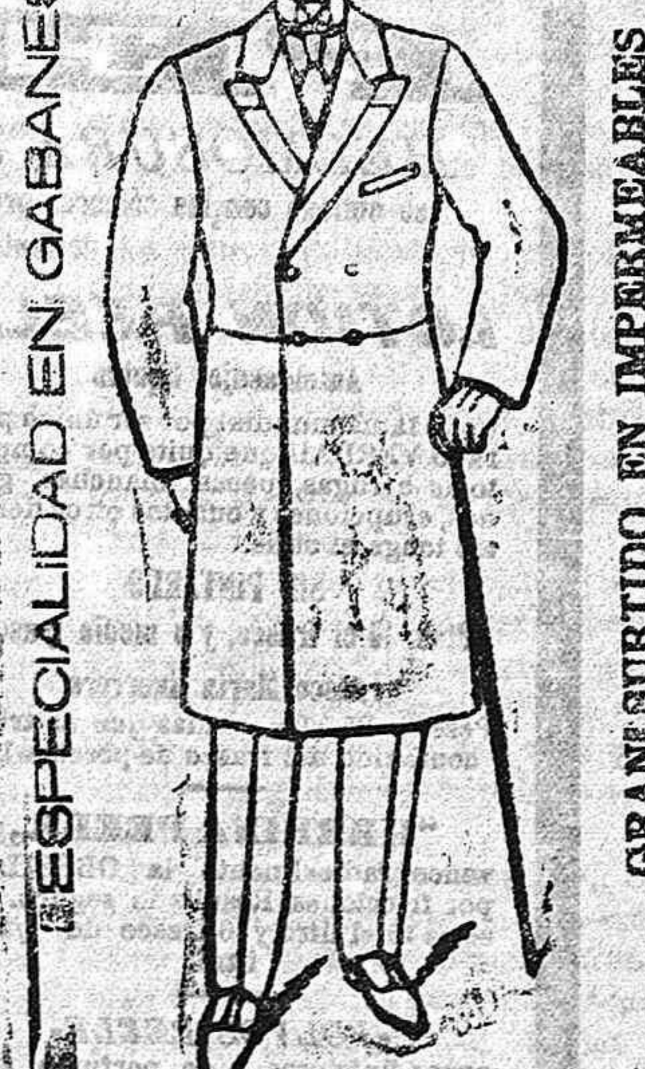
ESPECIALIDAD EN GABANES GRAN SURTIDO EN IMPERMEABLES

Servicio de automóviles ENTRE BILBAO Y VITORIA en combinación con el tranvía de Cénuri y los Ferrocarriles Vascongados