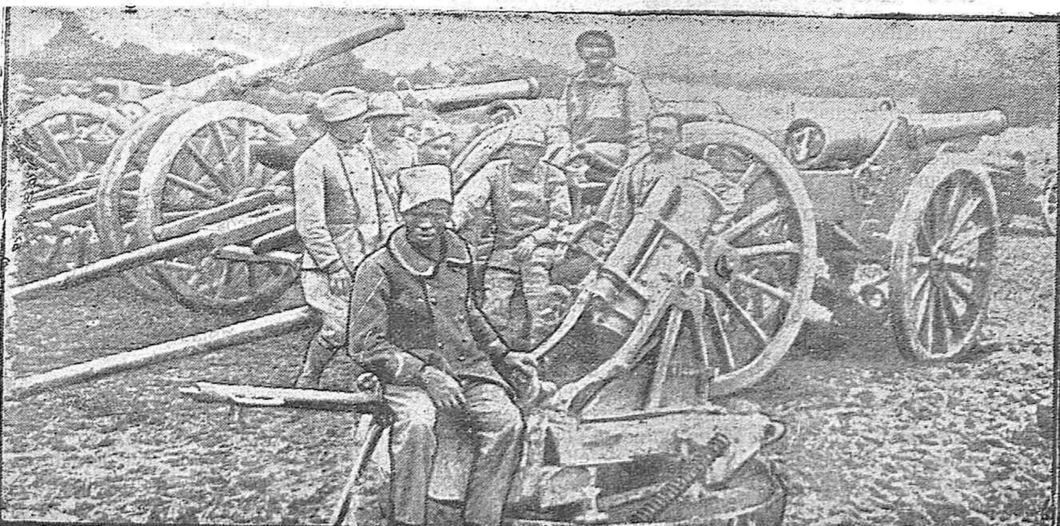
Senegaleses se baten en uno de los cañones armados al enemigo