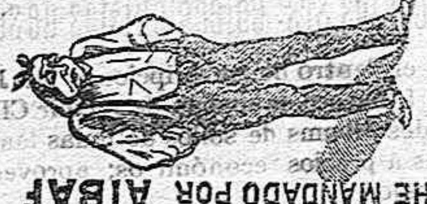
HE MANDADO POR AIBAF