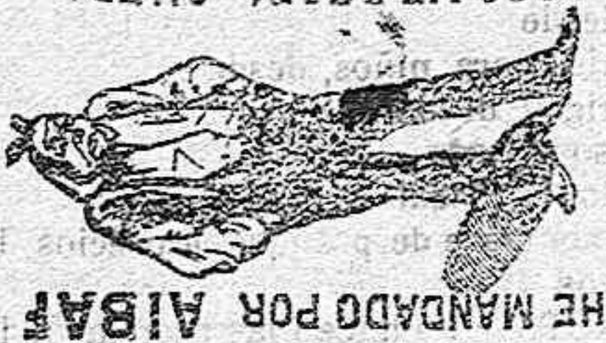
HE MANDADO POR AISAL