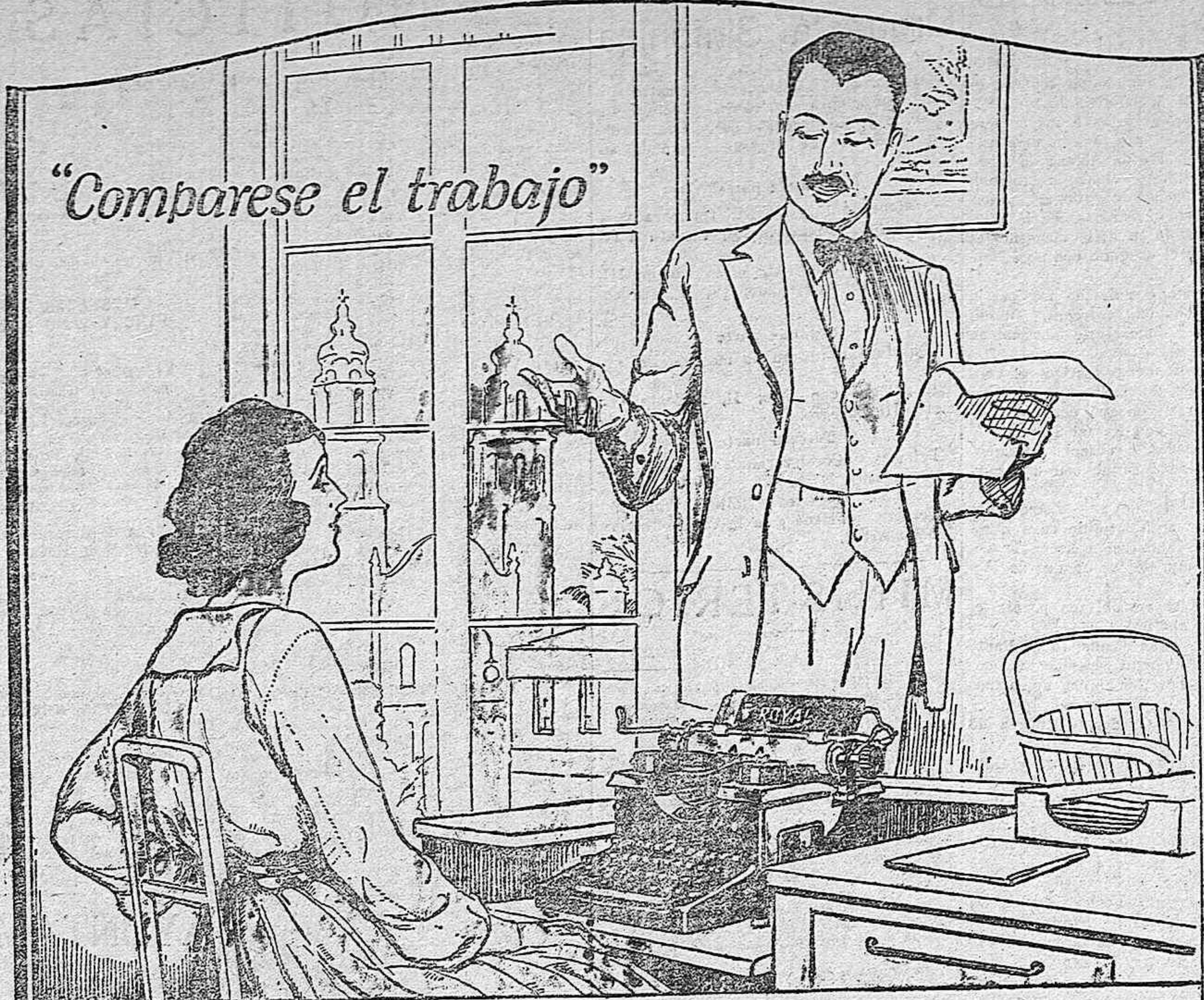
"Comparese el trabajo"

ESPECIALIDAD EN CAMAS DORADAS FABRICACION PROPIA CALIDADES EX. TRA. A DE 1. a precios íntimos. Casa Cabledes CARACAS, 9 y 9 D. ENTRE ALMAGRO, ZURBANO Y SANTA ENGRACIA